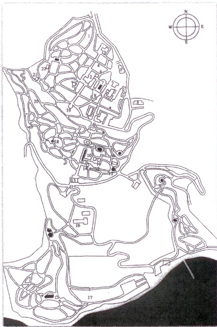
СХЕМА ГЕНПЛАНА НИКИТСКОГО БОТАНИЧЕСКОГО САДА