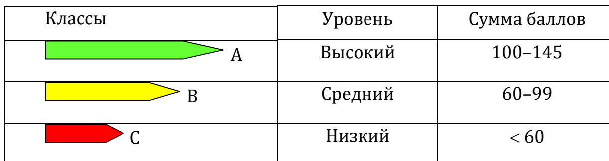
Таблица 2. Классы устойчивости среды обитания для жилых зданий

Согласно количеству набранных баллов по таблице 1 проекту присваивается класс устойчивости среды обитания по таблице 2.