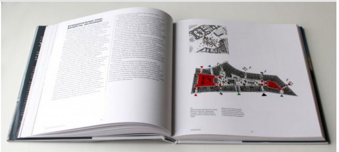
Олег Явейн. Эрмитаж XXI век. Новый музей в Главном штабе. London: Thames & Hudson Ltd., 2014.