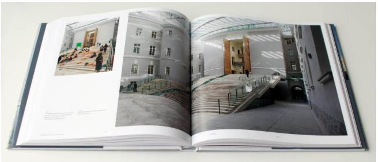
Олег Явейн. Эрмитаж XXI век. Новый музей в Главном штабе. London: Thames & Hudson Ltd., 2014.