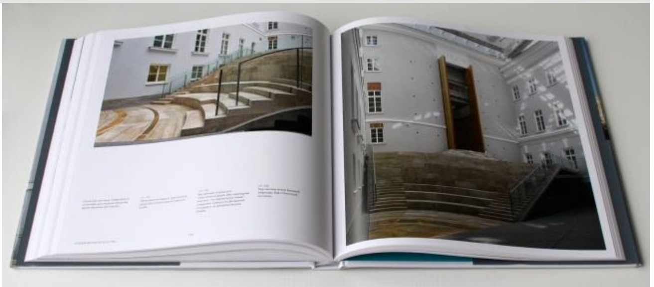
Олег Явейн. Эрмитаж XXI век. Новый музей в Главном штабе. London: Thames & Hudson Ltd., 2014.