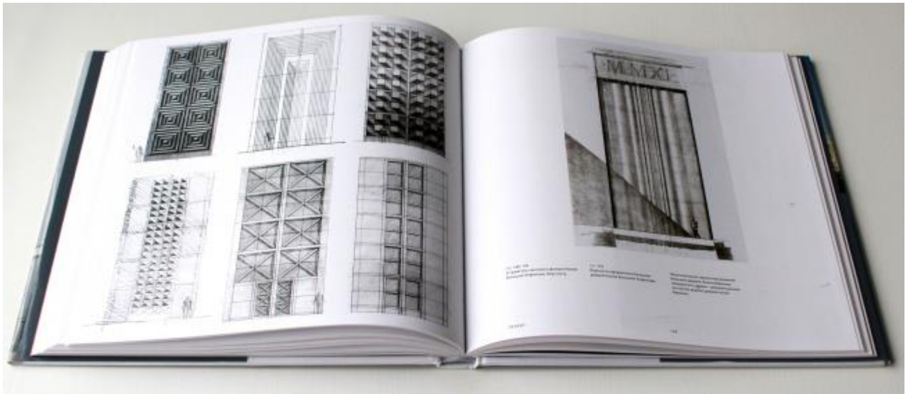
Варианты дверей (итоговый, с волнистой поверхностью, справа, его не удалось реализовать и пришлось заменить лаконичным вариантом) // Олег Явейн. Эрмитаж XXI век. Новый музей в Главном штабе. London: Thames & Hudson Ltd., 2014.

Множество заложенных в проект смыслов обладают привкусом конца XVIII века – с той лишь разницей, что люди Просвещения были в большей степени увлечены естествознанием, а авторы музея – историей, прежде всего здания и города. Найденная архитекторами главная ось, к примеру, воплотилась в виде стеклянной дорожки, прочерченной в полу и лестницах анфилады – и напоминает как солнечные часы в полах барочных храмов, так и черточки от маятника Фуко на полу Исаакия, провоцирующие задуматься о том, каким образом данное пространство встроено в структуру Вселенной в целом или города с его логикой и историей – в частности. К тому же авторы проводят аналогии между современной автоматикой трансформируемых музейных залов (управляющей экспозициями новейшего искусства и гигантскими дверьми, которые просто так не открыть) – и механизмами Нового Эрмитажа Фельтена, по случаю оказавшегося на линии оси анфилады, и его же недавно восстановленным «висячим садом» на крыше: в крытых дворах планировались деревья, тоже своего рода висячий сад, который, впрочем, устроить пока не удалось. Висячие мостики неожиданно напоминают о пассажах, добавляя к теме екатерининского просвещенного абсолютизма, с которого начался Эрмитаж как собрание, нотку историзированного романтизма, который уже был актуален во времена России, хотя и не столь сильно затронул его самого.