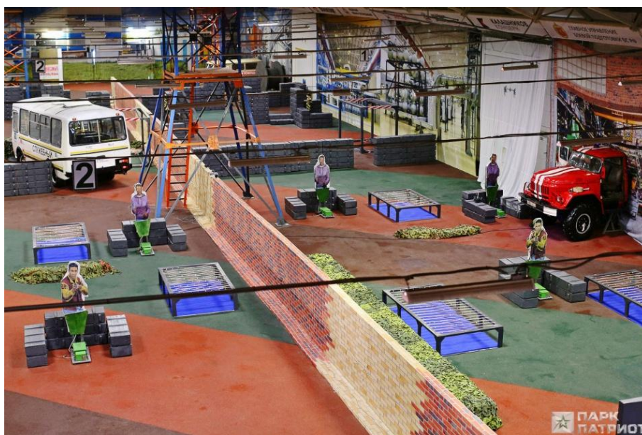
Рис. 3. Лазертаг-арена на территории ВППКиО «Патриот»

Следующим принципом проектирования ВПП можно назвать обязательное наличие образовательной составляющей, в которой традиционные и современные способы подачи информации рассматриваются как взаимодополняющие инструменты, призванные сделать историческое наследие доступным для посетителя, но уже в новых иммерсивных форматах. Музейный комплекс «Дорога памяти» представляет посетителям 35 тематических залов, 26 из которых иммерсивные 11 , с эффектом погружения в ключевые