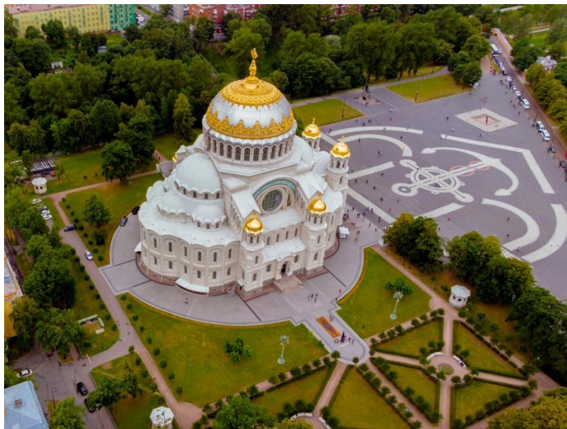
Рис. 1. Собор Святителя Николая Чудотворца в г. Кронштадт

технологии виртуальной реальности 7 . Также огромную роль играет историческая застройка, главным доминирующим элементом которой является Морской собор Святителя Николая Чудотворца (рис. 1), построенный в 1903-1913 годах по проекту архитектора В.А. Косякова [8]. На данном примере мы можем наблюдать применение современных цифровых технологий и актуальных способов подачи материала в образовательном аспекте музейно-исторического парка.