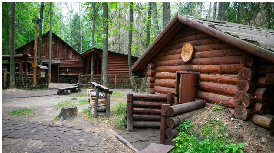
Рис. 2. Военно-исторический комплекс «Партизанская деревня» ВППКиО «Патриот»

и Страйкбол 10 (рис. 3). Игры помогают развить навыки командной работы, дать понимание тактики. В данном случае интерактивность выступает как способ пробуждения интереса у юных посетителей к военной и исторической тематике.