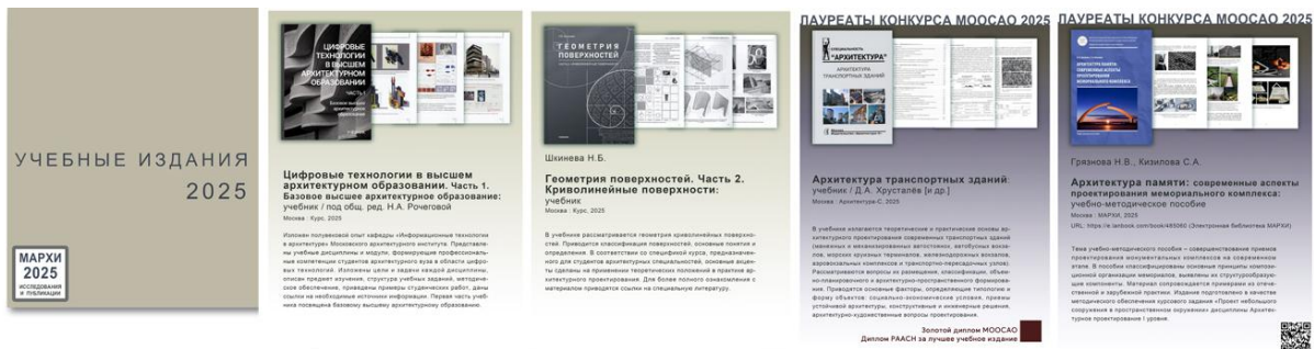
Рис. 2. Фрагменты экспозиции «Учебные издания 2025». Полная версия онлайн-экспозиции доступна по ссылке URL: https://lib.marhi.ru/MegaPro/Download/MObject/671

Также в экспозиции представлен учебник «Цифровые технологии в высшем архитектурном образовании. Часть 1. Базовое высшее архитектурное образование» (издательство «Курс», 2025) – уникальная разработка кафедры «Информационные технологии в архитектуре», отражающая методы преподавания компьютерных технологий в МАРХИ. Он подготовлен коллективом авторов под редакцией Н.А. Рочеговой. В плане подготовки учебных и учебно-методических пособий в 2025 году можно отметить кафедры «История архитектуры и градостроительства», «Основы архитектурного проектирования», «Градостроительство», «Инженерное оборудование зданий», «Конструкции зданий и сооружений». Это как традиционные печатные издания, так и издания МАРХИ, имеющие гибридный – печатный и электронный – формат, дополненные в экспозиции QR-кодами и ссылками для перехода к полным текстам.