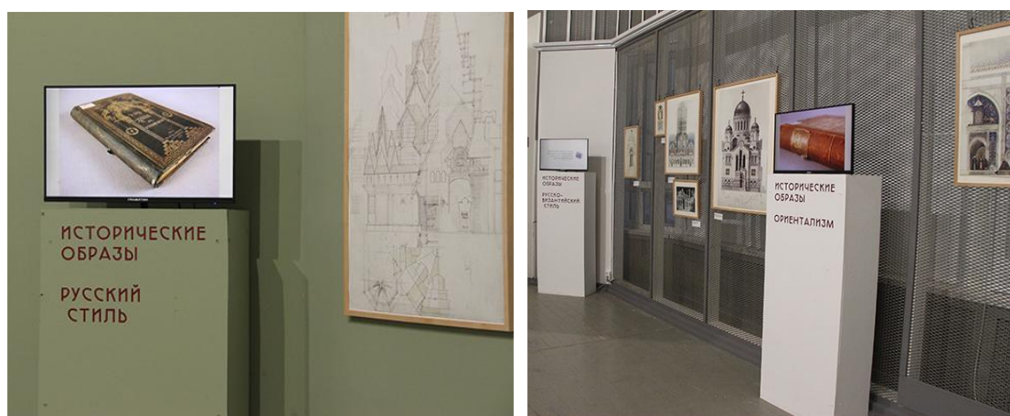
Рис. 6. Фрагменты экспозиции. «Исторические образы в творчестве Ф.О. Шехтеля и библиотека архитектора»

Представленные на выставке копии чертежей и эскизов Шехтеля (в основном из собрания ГНИМА имени А.В. Щусева), макеты его реализованных и нереализованных проектов (из фондов МАРХИ и ЦНТБ СиА) демонстрируют этапы творческой биографии архитектора, связанные с его увлечением разными историческими стилями: неоготикой, русским и византийским направлениями, восточными мотивами, античностью и неоклассикой. Отдельно представлены поиски архитектора в русле модерна. Каждый из этапов стилистических поисков дополнен видеопрезентациями подборок книг из личной библиотеки Шехтеля, что позволяет заглянуть в мир идей архитектора и проследить влияние художественных течений, открытий исторической науки и инженерных новаций того времени на его творчество.