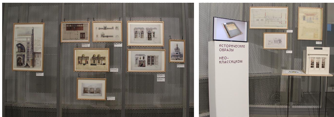
Рис. 7. Фрагменты экспозиции. «Исторические образы в творчестве Ф.О. Шехтеля и библиотека архитектора»