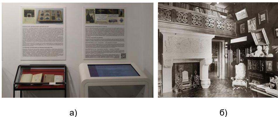
Рис. 3. Фрагменты экспозиции: а) раздел, посвященный истории библиотеки Шехтеля, демонстрационный стол с электронной экспозицией книг; б) библиотека в кабинете Ф.О. Шехтеля в Ермолаевском переулке

Наглядно показать дошедший до нас фрагмент книжного собрания Шехтеля – одна из задач выставки. Основу экспозиции составили видеопрезентации книг (из фондов ЦНТБ СиА и МБК МАРХИ), а также несколько оригиналов книг, принадлежавших Шехтелю, и изданий с его автографами (из собрания МБК МАРХИ). На выставке можно увидеть уникальную электронную коллекцию книг из личного собрания Шехтеля: полистать на демонстрационном интерактивном столе страницы полнотекстовых копий нескольких десятков изданий и документов из собраний ЦНТБ СиА и МБК МАРХИ, ознакомиться с расширенной версией подготовленной Шехтелем рукописи лекции «Сказка о трех сестрах: Архитектуре, Живописи и Скульптуре» (из собрания ГНИМА им. А.В. Щусева). Представленная коллекция интересна еще и тем, что позволяет увидеть общий список оцифрованных книг, размещенных в соответствии с нумерацией по каталогу Шехтеля.