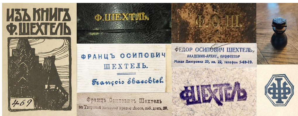
Рис. 4. Фрагмент экспозиции, посвященный владельческим книжным знакам Шехтеля

В представленных изданиях обращают на себя внимание владельческие книжные знаки, пометы, автографы архитектора. В библиотеке Шехтеля немало книг в специально заказанных переплетах; часто на них встречаются тисненные инициалы «Ф. Ш.», «Ф. О. Ш» или надписи «Ф. Шехтель», «F. SCHECHTEL». Известно несколько разных оттисков книжных штемпелей Шехтеля, разработанных им самим: восьмиугольный вензель-монограмма «ФШ» (конец XIX века); штемпель с декоративной надписью «Ф Шехтель» (начало XX века); «Франц Осипович / Шехтель / Francois Shaechtel» (до перехода зодчего в православие в 1915 году) и другие. В 1900-е годы Шехтель разработал собственный книжный знак – художественный экслибрис, выполненный в технике цинкографии. Для маркировки книг Шехтель использовал образ своего реализованного проекта – главного павильона Русского отдела на Международной выставке в Глазго 1901 года.