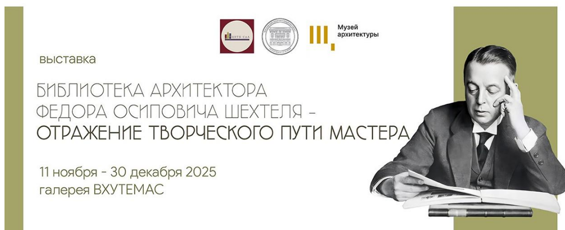
Рис. 1. Афиша выставки

11 ноября 2025 года в галерее ВХУТЕМАС Московского архитектурного института состоялось открытие выставки «Библиотека архитектора Федора Осиповича Шехтеля – отражение творческого пути мастера». Выставка была подготовлена Музейно-библиотечным комплексом МАРХИ и Центральной научно-технической библиотекой по строительству и архитектуре ФБУ «РосСтройКонтроль» (ЦНТБ СиА) при участии Государственного научно-исследовательского музея архитектуры имени А.В. Щусева. В основе экспозиции – уникальная коллекция книг и документов из личной библиотеки Федора Осиповича Шехтеля (1859-1926), выдающегося представителя плеяды московских архитекторов рубежа XIX – XX веков.