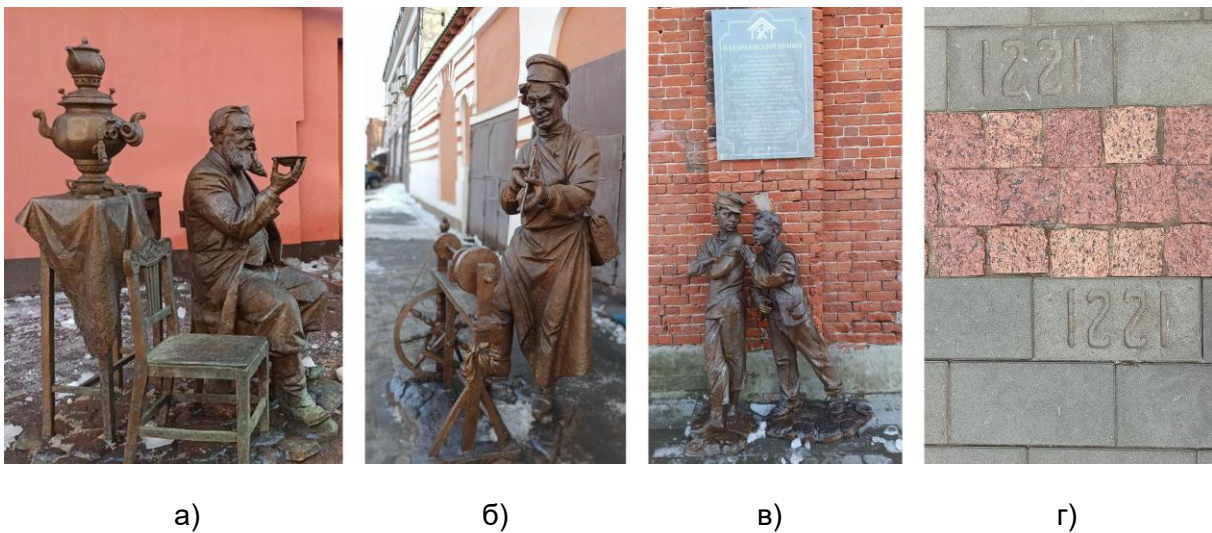
Рис. 3. Демонстрация исторических особенностей территории в городской среде Кожевенной улицы в Нижнем Новгороде: а) купец за самоваром; б) точильщик ножей; в) беспризорники-мальчишки из Назарьевского приюта; г) покрытие с обозначением года основания города