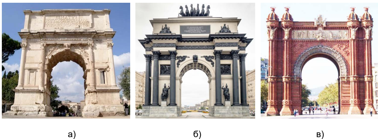
Рис. 4. Эволюция и традиция в сооружении Триумфальных арок: а) Арка Тита в Риме; б) Триумфальная арка в Москве; в) Адмиралтейская арка в Барселоне

В ансамблевой архитектуре дизайн и облик портала воспринимаются только в общей концепции здания. Но если можно отделить портал от здания, для которого он был возведен, он приобретёт свою художественную самостоятельность. Примером этому могут служить многочисленные триумфальные арки, ставшие центрами городских пространств центральной Европы. Триумфальная арка барокко, и классицизма стала самостоятельным архитектурным сооружением – монументальным порталом в воображаемую перспективу, созданным в отрыве от архитектурных ансамблей. Здесь основная идея портала воплощена в чистом виде – портал отделён от здания, с сохранением его основной функции: вход и выход в одном сооружении. В триумфальной арке гармонично соединились два портала, сохранив свою художественную индивидуальность. Таким образом, портал приобретает самостоятельную функцию вне здания являясь независимым произведением искусства, сопоставимым с произведениями монументальной скульптуры на городских площадях и парках (рис. 4а-в).