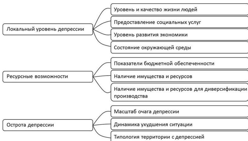
Рис. 5. Показатели территориальной депрессивности

В статье экономистов П.М. и Г.И. Мансуровых приводится весьма конкретизированный перечень показателей, основные из которых приведены на рис. 5 [4].