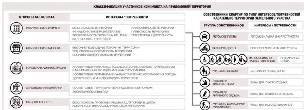
Рис. 3. Классификация участников градостроительного конфликта на придомовой территории многоквартирных домов [6]

интересами. Авторы приводят классификацию участников конфликта на придомовой территории с укрупненным указанием их потребностей (рис. 3).