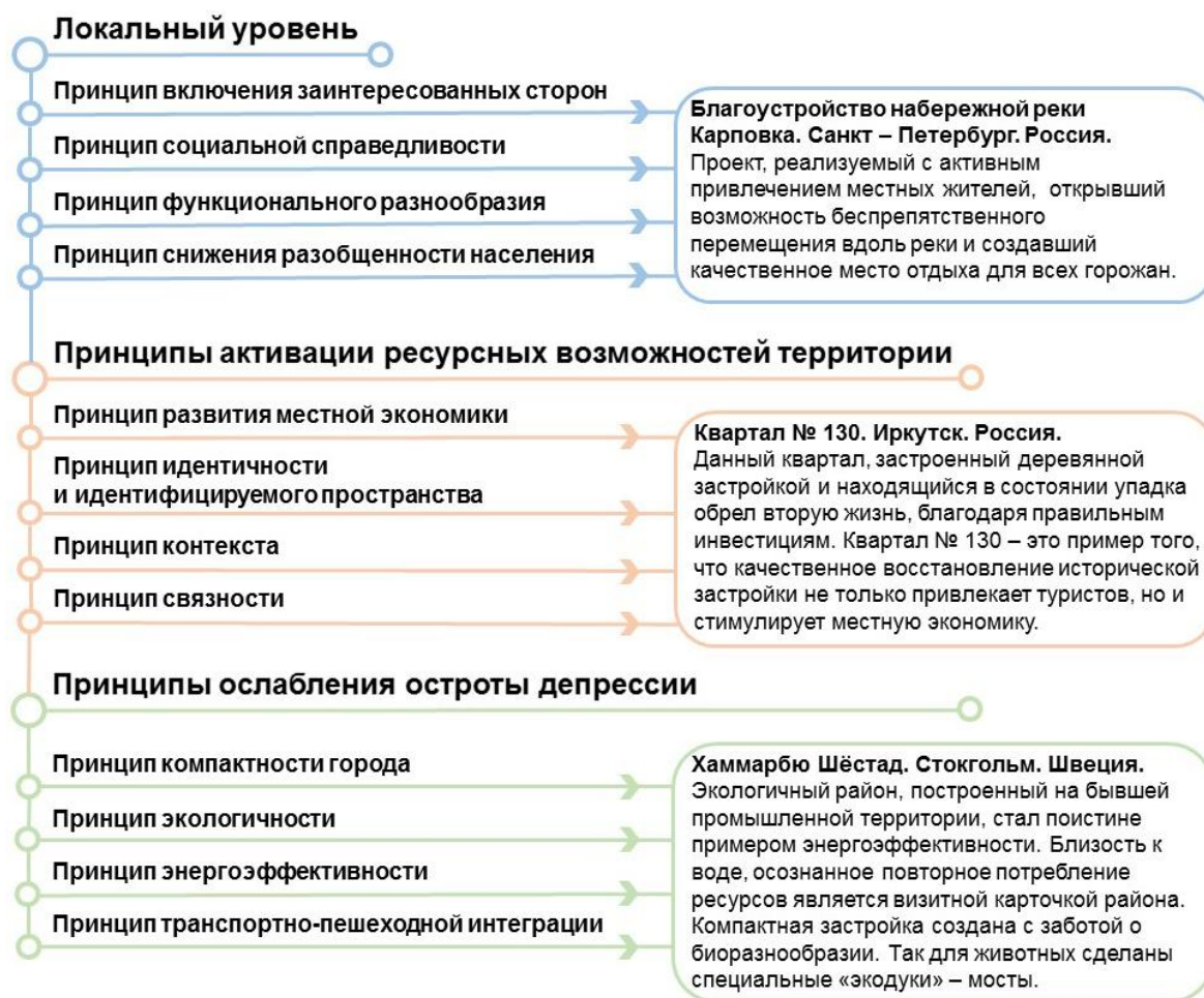
Рис. 6. Реализованные проекты, где применены сформированные принципы

Приведенные принципы в совокупности способны дать видимый эффект в течение короткого промежутка времени и одновременно с этим простимулировать соседствующие с территорией городские структуры к развитию. Конкретные примеры, иллюстрирующие применение сформированных принципов проиллюстрированы на рис. 6.