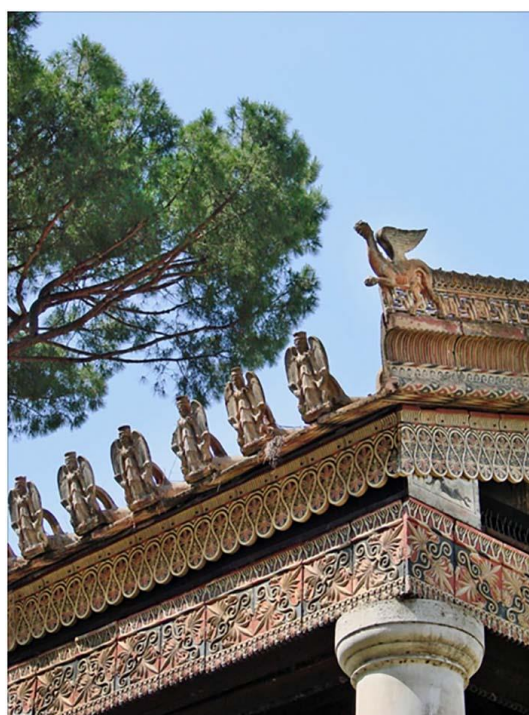
Рис. 13. Реконструкция фрагмента этрусского храма по Витрувию

Этруски строили из глины и дерева, поэтому их здания не сохранились, и представлять архитектуру этрусков приходится по описаниям Витрувия и данным раскопок. Реконструкция на рис. 13 позволяет представить великолепный цветной декор, украшающий этрусский храм.