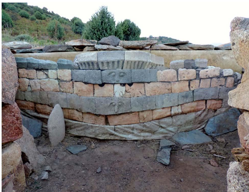
Рис. 5. Священное место в С'Арку-э-Форрос в Виллагранде-Стрисай

Некоторые святилища были настолько большими, что могли служить одновременно нескольким кланам, населяющим большую часть острова. Таким огромным святилищем площадью в 20 гектаров было, например, святилище Санта-Виттория близ Серри. Этот комплекс включал одновременно религиозные и гражданские здания. Итальянский историк Д. Лиллиу считает, что именно в этом месте проживали основные кланы центральной части Сардинии [7]. Здесь они собирались для заключения коммерческих сделок, решения вопросов войны и мира, союзов между кланами. Здесь были жилые и общественные постройки, а также религиозные сооружения по типу священного «бассейна» Су-Романзесу (рис. 6). На Сардинии известно по меньшей мере двадцать таких многофункциональных комплексов, в том числе Санта-Кристина в Паулилатино.