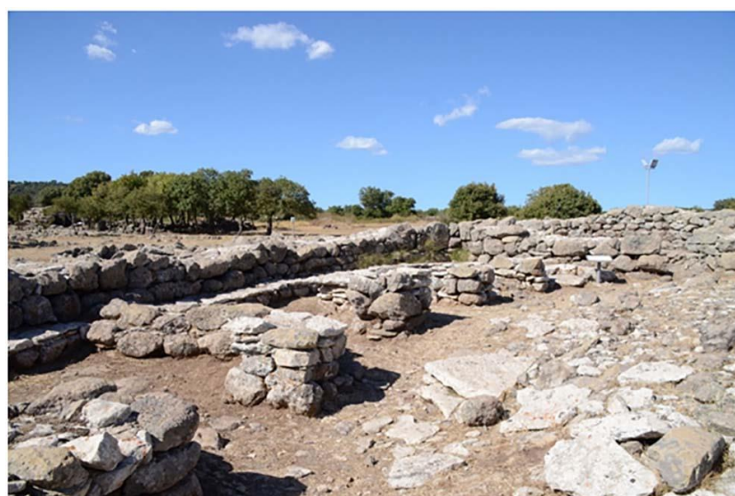
Рис. 3. Руины праздничной торговой площади в святилище Санта-Витториа ди Серри