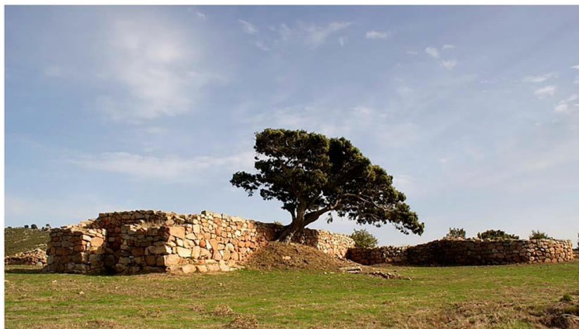
Рис. 8. Храмовый комплекс С'Арку-э-сос-Форрос с мегаронным храмом Дом-де Оргия в Эстерзили