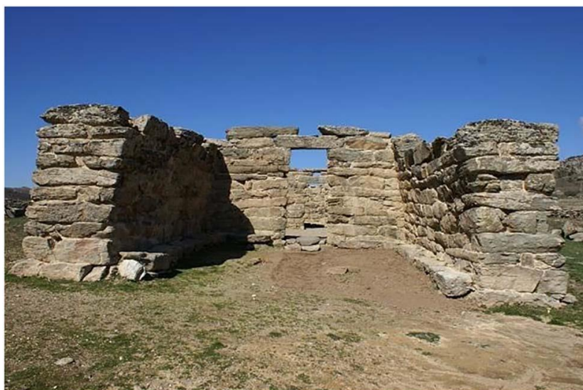
Рис. 7. Мегаронный храм Дом Оргии в Эстерзили

в Арзакене, одна из стен могла иметь абсидальную полукруглую форму [10]. Две боковые стены выдвинуты вперед в сторону входа (рис. 7).