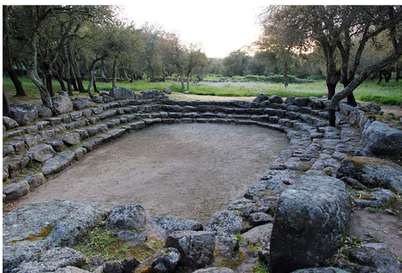
Рис. 6. Священный «бассейн» Су-Романзесу

Некоторые святилища были настолько большими, что могли служить одновременно нескольким кланам, населяющим большую часть острова. Таким огромным святилищем площадью в 20 гектаров было, например, святилище Санта-Виттория близ Серри. Этот комплекс включал одновременно религиозные и гражданские здания. Итальянский историк Д. Лиллиу считает, что именно в этом месте проживали основные кланы центральной части Сардинии [7]. Здесь они собирались для заключения коммерческих сделок, решения вопросов войны и мира, союзов между кланами. Здесь были жилые и общественные постройки, а также религиозные сооружения по типу священного «бассейна» Су-Романзесу (рис. 6). На Сардинии известно по меньшей мере двадцать таких многофункциональных комплексов, в том числе Санта-Кристина в Паулилатино.