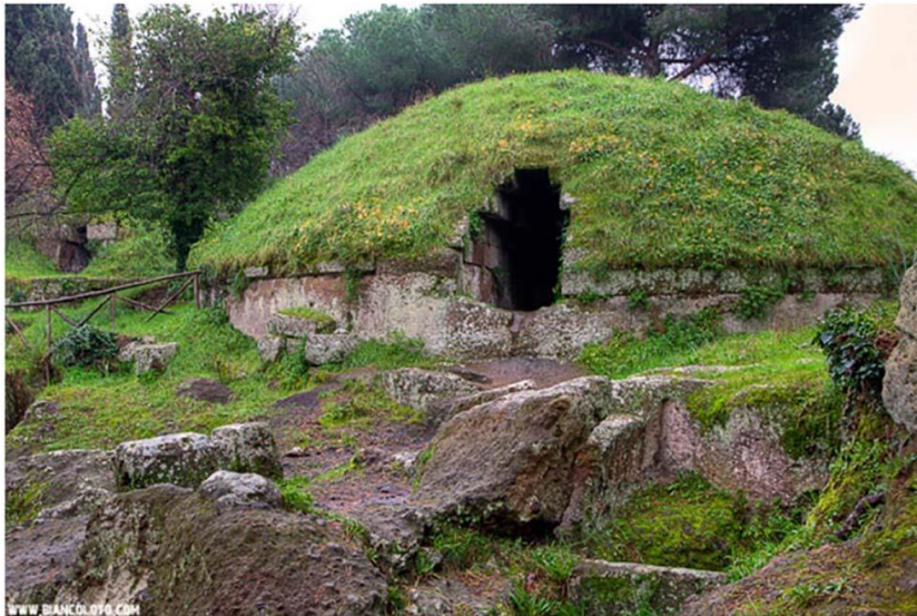
Рис. 9. Этруская гробница тумулос в Черветери