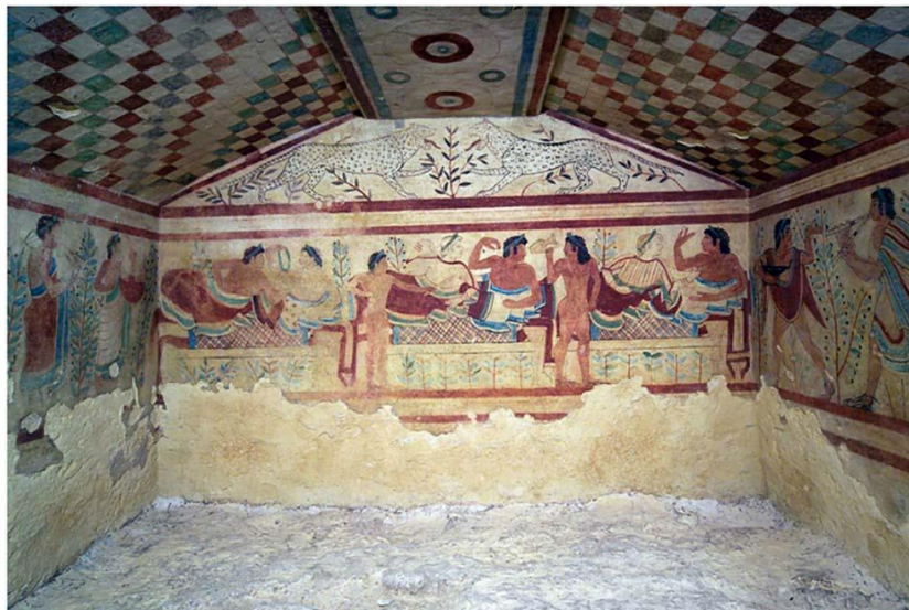
Рис. 10. Фрески этрусской гробницы Тарквинии. Италия