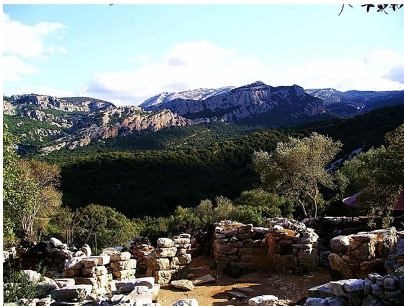
Рис. 1. Город Каррос конца Бронзового века