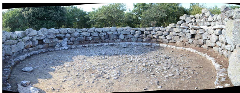
Рис. 2. Хижина общественных собраний. Санта-Витториа ди Серри