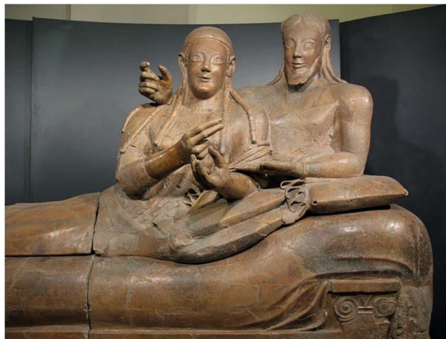
Рис. 11. Этруская погребальная скульптура. Семейный саркофаг, вилла Джулия. Рим