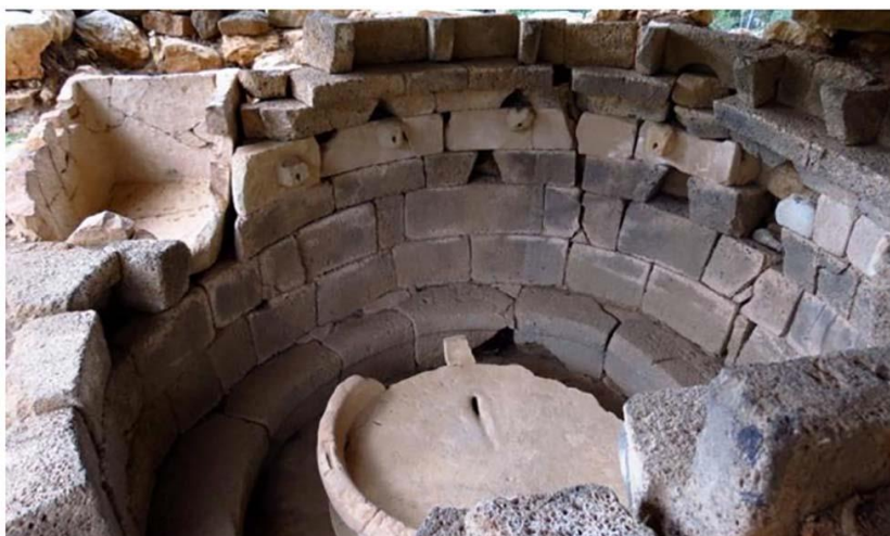
Рис. 4. Ритуальный фонтан Са Седда-э-Сос-Каррос, близ Олиены

Технические достижения в области обеспечения водой связаны, прежде всего, с устройством в поселениях как минимум колодцев, а в определенных случаях, как например, в Нураге Аррубиу – созданием сложного гидравлического устройства для дренажа воды. В конце бронзового века и начале железного века появляются круглые строения с бассейнами в центре. Вокруг бассейна устроены скамейки по всей окружности помещения. Примером такого сооружения может служить ритуальный фонтан Са Седда-э-Сос-Каррос, близ Олиены (рис. 4). По свинцовым трубам вода через устроенные в стенах протоны в форме головы барана поступала в бассейн. Помимо того, что эти сооружения несли некую ритуальную функцию, предположительно, они представляли собой еще и термальное сооружение. Иначе трудно объяснить скамьи, которые оказываются под потоками воды из протонов. Правда, воду можно было остановить на определенное время. В связи с культом воды и обеспеченностью водой населения необходимо вспомнить о ритуальных колодцах. Однако такие колодцы создавались на Сардинии еще в период расцвета нурагической культуры, что определило анализ этих сооружений в предыдущей статье цикла [9].