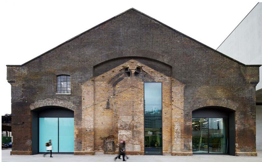
Рис. 1. Центральный колледж искусства и дизайна имени Святого Мартина, С. Виллиамс, 2011 г.

Постпамять фиксирует ситуацию, в которой невозможно полностью восстановить и повторить воспоминания, памятные образы и моменты прошлого. Приходится признать, что ни какая история не доходит до нас целой. Примером, материализующим в архитектуре это положение, когда память непостижима и знание недоступно, служит проект реконструкции амбара 1900 г. в городе Дилбек под функцию жилого дома (Бельгия, Objekt Architecten, 2017 г.). Кирпичный остов бывшего амбара дополнен новым бетонным блоком, который «вставлен» внутрь старых конструкций. При этом образуется «зазор» – пустое пространство, которое служит фиксацией разрыва между прошлым и настоящим. Восстановление абриса здания происходит не по форме оригинального амбара, что создает контраст и артикулирует состояние мгновения между забыванием и припоминанием. Противоположность старого кирпича и нового гладкого бетона усиливает образ объекта-носителя памяти (рис. 2).