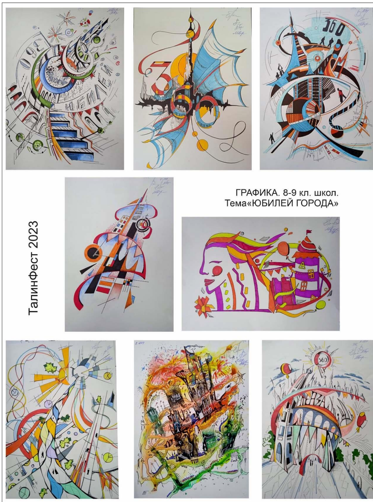
Рис. 2. Работы по теме «Юбилей города». Творческий конкурс ТатлинФест-2023. Олимпиада по графике для школьников 8–9 классов

Творческие задания для олимпиад студентов и школьников разрабатываются преподавателями ПГУАС, то есть университета, на базе которого проводится творческий конкурс. Темы творческих работ по графике и композиции связаны с экспериментами в