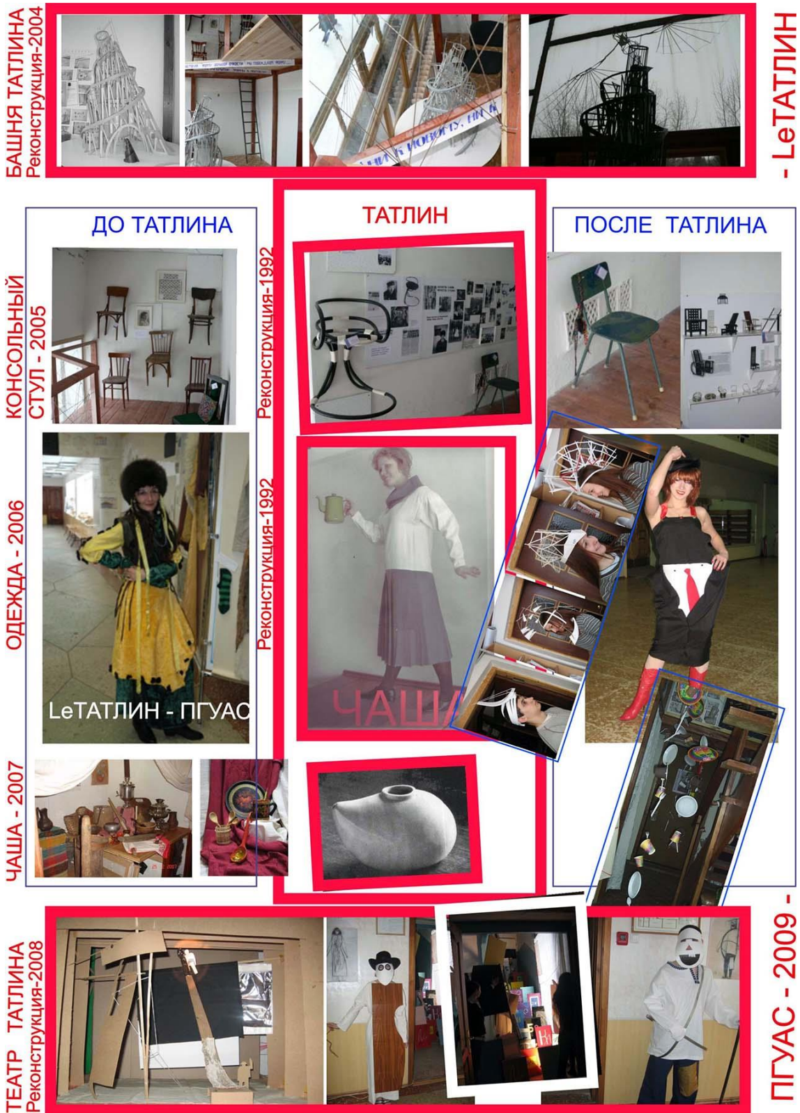
Рис. 3. Экспозиция выставки «Квартира Татлина». Разные грани творчества мастера. Художник-авангардист В. Татлин как водораздел в искусстве традиционном и новом

области новейшей архитектурной формы. В первую очередь идёт обращение к примерам из многогранного творчества художника Владимира Татлина. Об авангардных работах Татлина участниками конкурсов каждый год рассказывает выставка «Квартира Татлина», где собран материал об этом известном во всем мире мастере, также тут хранятся работы победителей конкурсов-олимпиад (рис. 3).