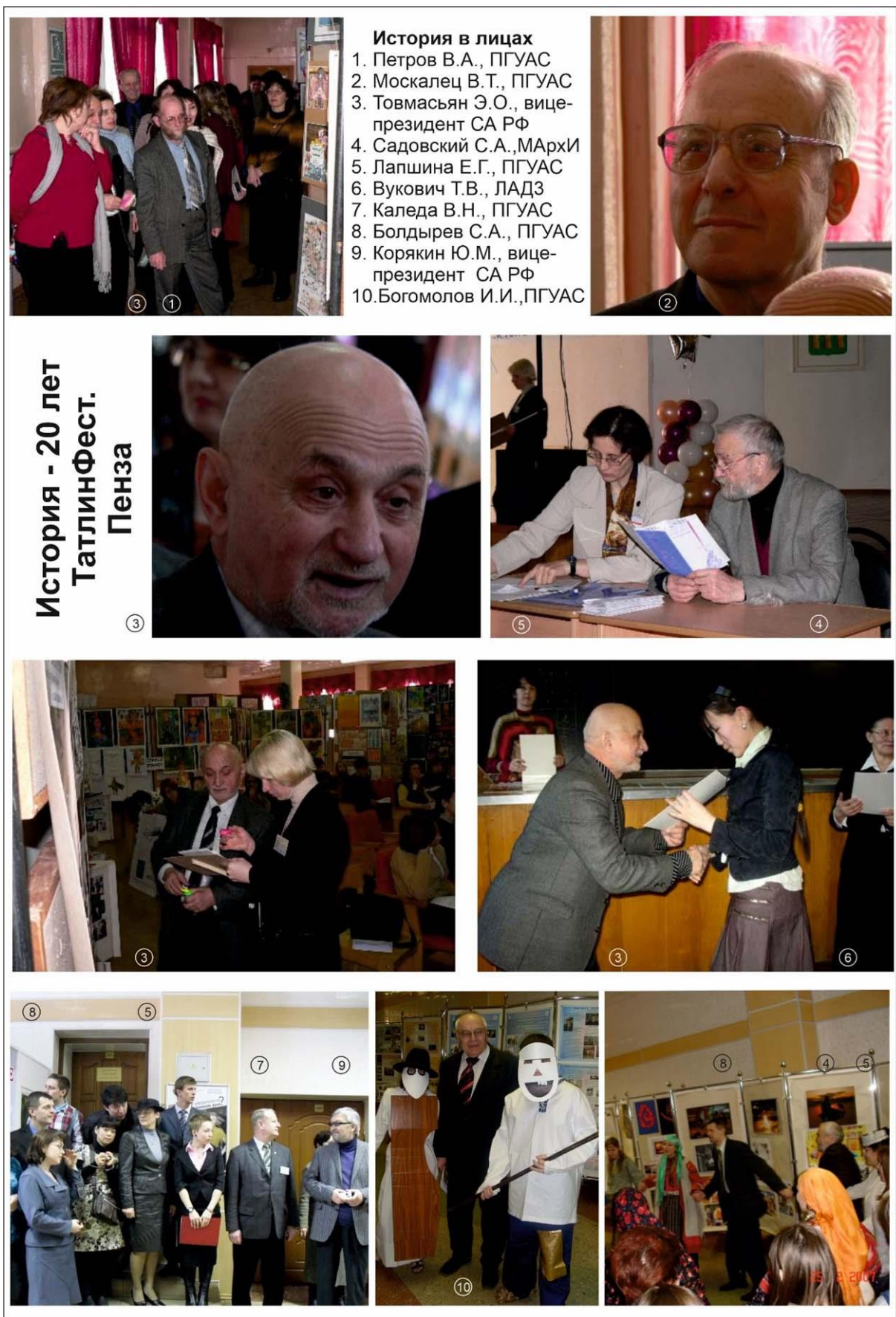
Рис. 6. Фотографии из истории развития творческого конкурса им. В. Татлина, 2000-е гг.