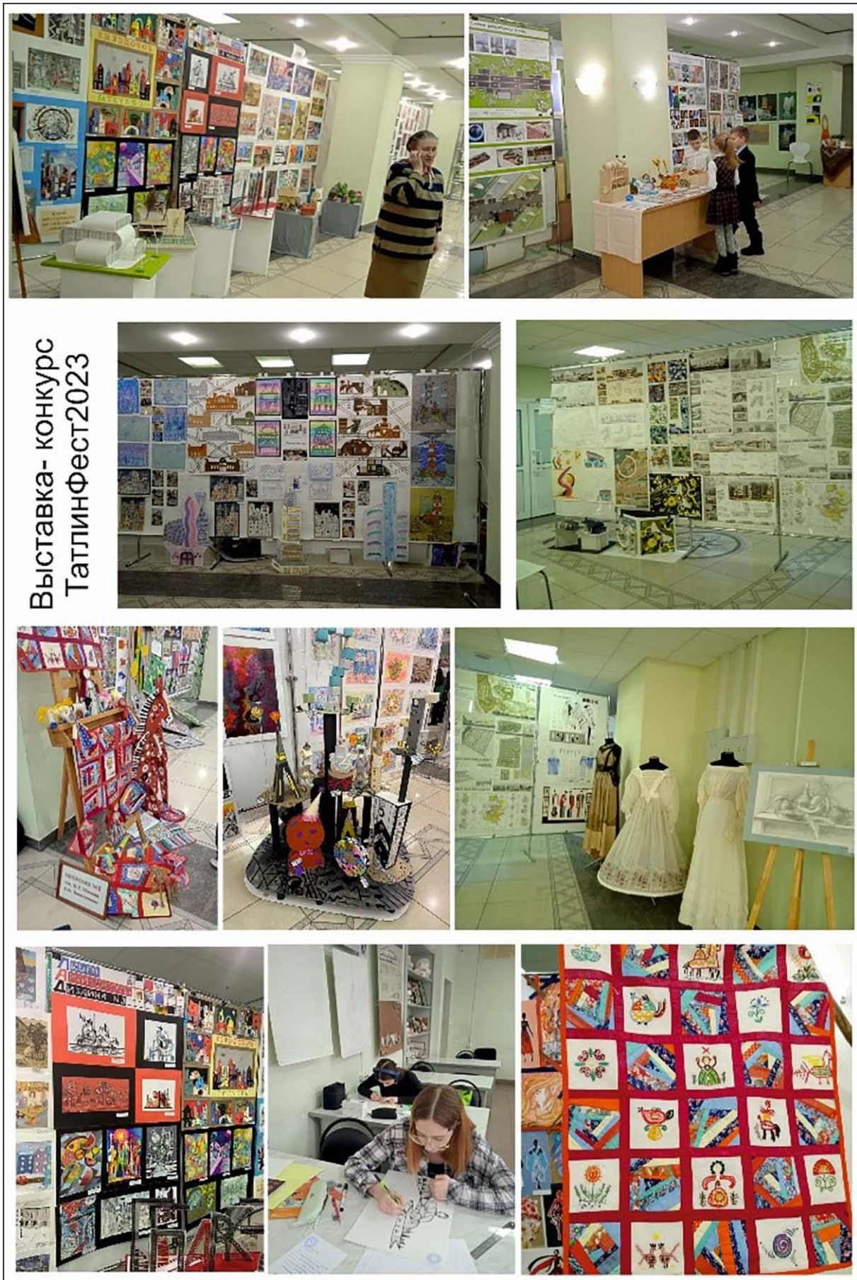
Рис. 5. Экспозиция выставки-конкурса фестиваля им. Татлина, 2023 год