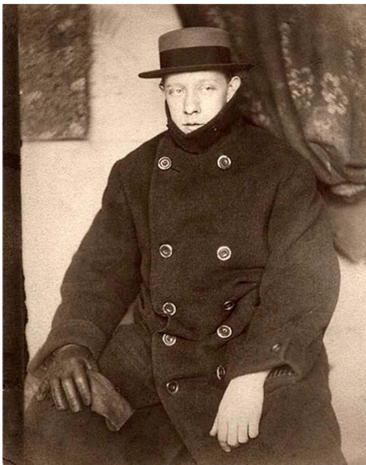
Рис. 7. Татлин Владимир Евграфович (1885–1953) – одна из ключевых фигур русского авангарда и основоположник художественного конструктивизма. Фото 1914 года

Владимир Евграфович Татлин стал выпускником Пензенской художественной школы. Он «окончил Пензенское художественное училище со званием «профессионального рисовальщика (по отделу живописи) с правом преподавать рисование, черчение и чистописание в средних учебных заведениях». Его аттестат №791 датирован 30 июня 1910 г.» [10]. Он не учился в академии художеств после получения аттестата рисовальщика. Но в советской России Татлин В.Е. в 1920–30-е гг. работал профессором ВХУТЕМАСа (Москва и Петроград, Высшие художественно-технические мастерские), во ВХУТЕИНе, (поскольку академия изящных искусств была преобразована в мастерские, а затем образован высший художественно-технический институт). В 1931 году художник Татлин получает звание «Заслуженный деятель искусств РСФСР» 6,7 [11].