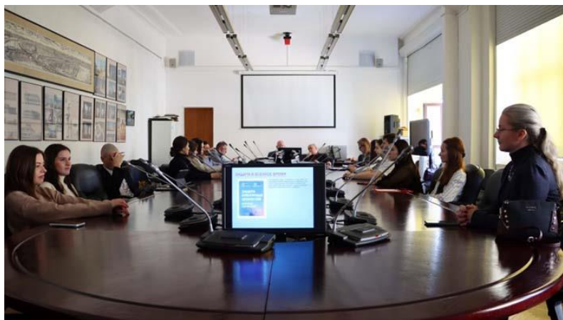
Заседание круглого стола, посвященного вопросам сохранения архитектурного наследия

Как никогда широко освещалась тема сохранения культурного наследия. Прошедший 2022 год был объявлен Президентом РФ Годом культурного наследия народов России. Фактически, неким промежуточным подведением итогов и стали заседания секции «Реконструкция и реставрация в архитектуре», круглые столы «Сохранение объектов культурного наследия как национальная и общественная политика. Рекомендации ЮНЕСКО», «Посттравматическая реконструкция объектов Всемирного культурного наследия ЮНЕСКО».