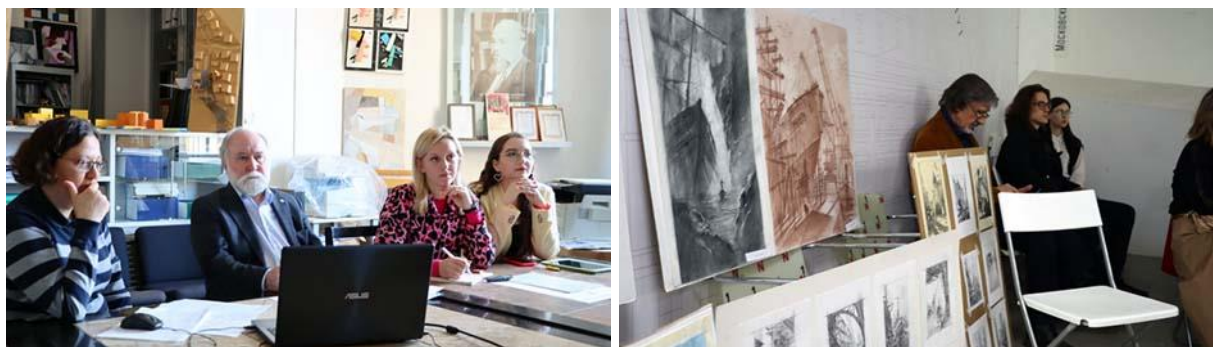
Заседание круглых столов по световому дизайну и художественному образованию архитектора

Как никогда широко освещалась тема сохранения культурного наследия. Прошедший 2022 год был объявлен Президентом РФ Годом культурного наследия народов России. Фактически, неким промежуточным подведением итогов и стали заседания секции «Реконструкция и реставрация в архитектуре», круглые столы «Сохранение объектов культурного наследия как национальная и общественная политика. Рекомендации ЮНЕСКО», «Посттравматическая реконструкция объектов Всемирного культурного наследия ЮНЕСКО».