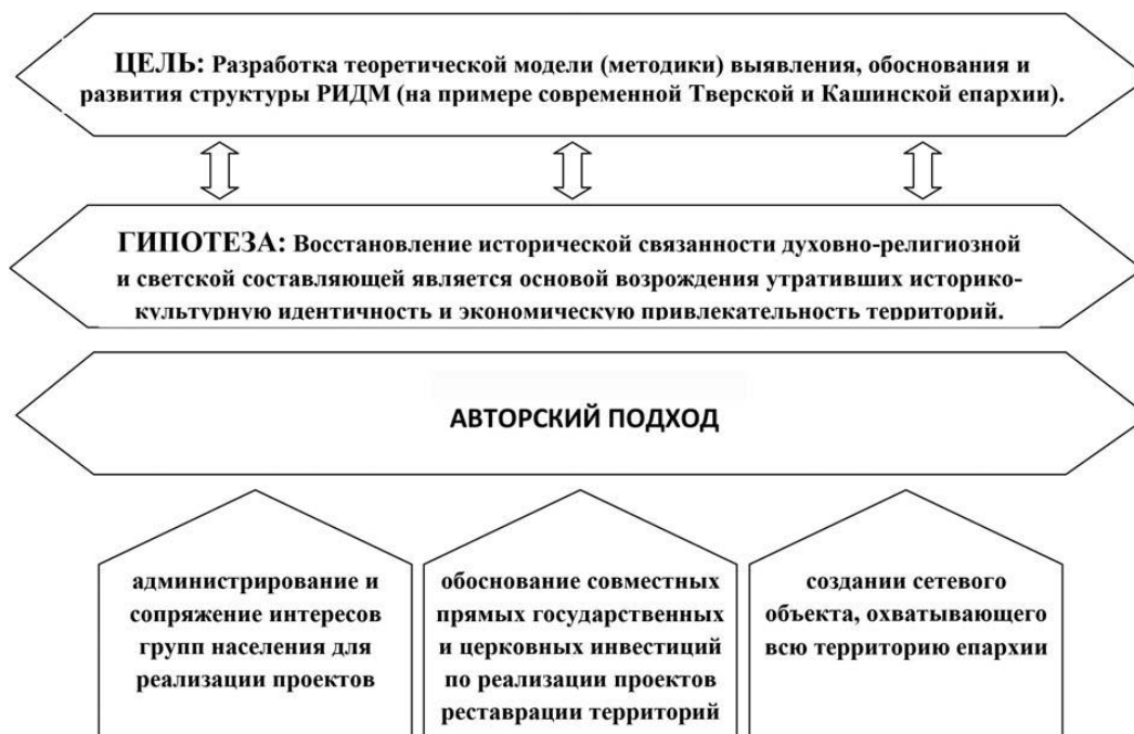
Рис. 3. Структура исследования

1. Церковь имеет недвижимость и заинтересована в развитии территорий. Это подсказывает первый тип церковно-социального сотрудничества – администрирование и сопряжение интересов групп населения для реализации инвестиционных проектов. Иными словами, сценарий предусматривает устройство связующих элементов между социальными группами. Учитывая сложившиеся партнерские отношения Церкви и государства, это вполне реальный сценарий, требующий, однако, методики создания и обоснования таких проектов.