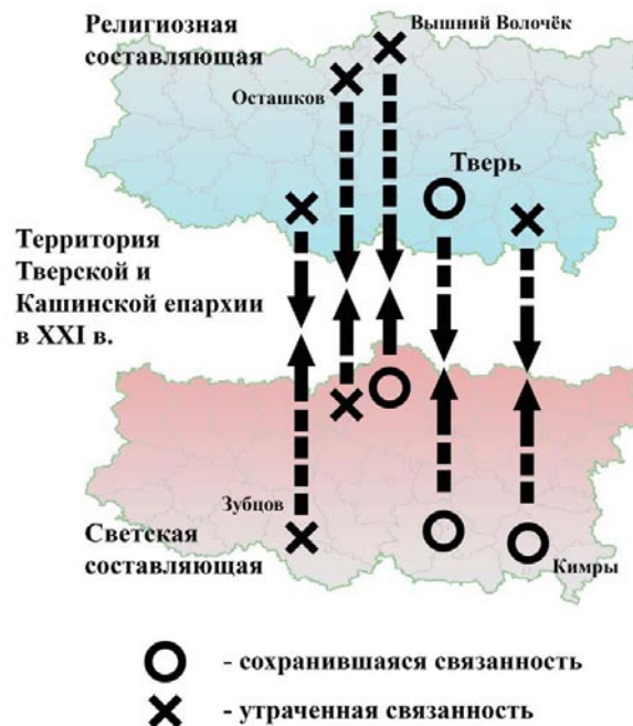
Рис. 2. Восстановление «неслитного и нераздельного» характера исторической связанности духовно-религиозной и светской составляющей в формировании, сохранении и развитии структуры традиционного российского общества и его проявлений в организации архитектурной среды

деятельности Церкви на такие факторы устойчивого развития, как инвестиционная привлекательность, уникальность, аутентичность, интеллектуализация населения, популяризация культурного наследия. В соответствии с результатами исследования впервые предлагаются перспективные сценарии выявления, обоснования и развития структуры РИДМ, методика их идентификации и обоснования (рис. 3).