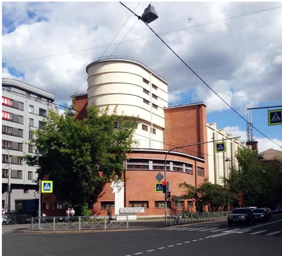
ТЭЦ трикотажной фабрики «Красное знамя»

Планомерное изучение промышленной архитектуры Петербурга началось четверть века назад. В середине 1990-х годов вышла в свет книга М.С. Штиглиц 1 – первое серьезное исследование по этой теме. Одновременно в Комитете по охране памятников Санкт-Петербурга под ее руководством был создан отдел промышленной архитектуры. Усилиями сотрудников удалось изучить и поставить под государственную охрану свыше 200 адресов.