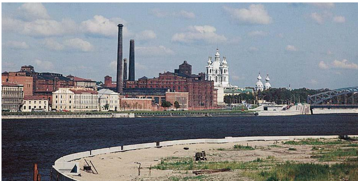
Смольный собор и Невская бумагопрядильная мануфактура барона Штиглица

Освободившись в начале XX века от канонов высоких стилей, промышленная архитектура получила широкие возможности нового формообразования мощной брутальной экспрессии, придающей городским индустриальным пейзажам своеобразный колорит. Такова, например, расположенная неподалеку от Смольного собора Невская бумагопрядильная мануфактура барона Штиглица, протяженные краснокирпичные корпуса и взметнувшиеся ввысь трубы которой эффектно контрастируют с живописным силуэтом собора. Довершает картину Большеохтинский мост (1909–1911 гг.) с ажурными громадами металлических ферм.