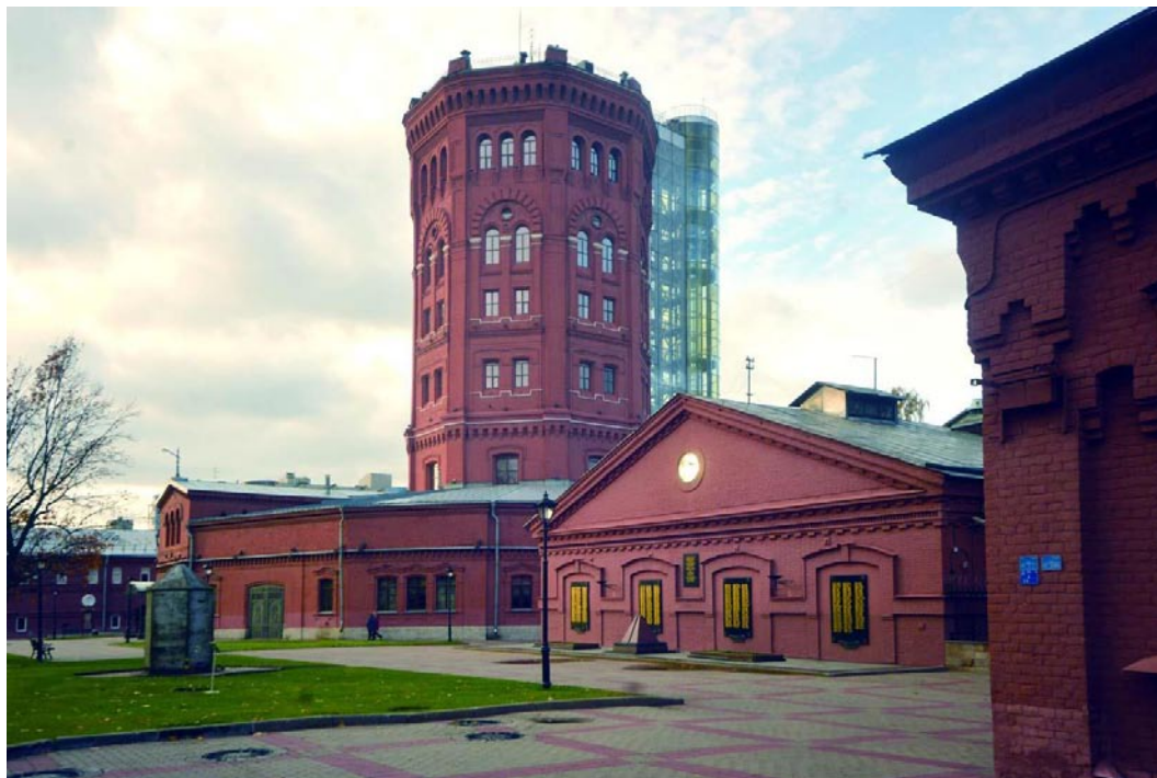
Музей «Мир воды» в водонапорной башне Главной водопроводной станции

К сожалению, гораздо большее число насчитывает список утраченных памятников. Но помимо потери отдельных памятников наблюдаются заметные изменения ландшафтной среды, и в этом заключается особый драматизм нынешней ситуации. Нарушаются визуальные взаимосвязи и масштаб пространств, искажаются видовые панорамы и перспективы, то есть те особенности, которые в первую очередь составляют неповторимый облик Санкт-Петербурга.