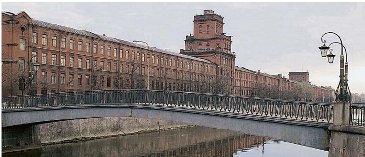
Здание Российско-американской резиновой мануфактуры «Треугольник»