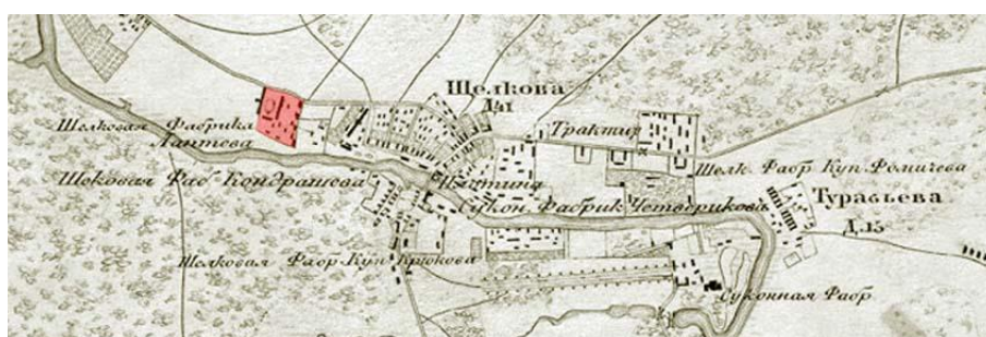
Рис. 3. Расположение Щелковской шелкоткацкой фабрики на топографической карте окрестностей Москвы 1852 года (выделено красным)

История появления русского Лиона началась после 1720 года, когда в Гребневе, Фрязине и других деревнях Богородского уезда, купцы и зажиточные крестьяне становились основоположниками шелкоткацкой крестьянской промышленности [2]. На территории современного города Щелково Московской области было несколько деревень и три шелкоткацких фабрики, а также множество домашних мелких частных мастерских. Фабрики располагались на берегу Клязьмы, где были построены краснокирпичные цеха, и сейчас, в начале XXI века, две из них стали нефункционирующими промышленными территориями. Только одна из фабрик – Щелковская шелкоткацкая фабрика – до сих пор успешно работает на части территории некогда огромного производства шелковых тканей.