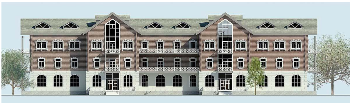
Рис. 9. Эскиз фасада жилого дома. Предложение МАРХИ (студентка К. Кеввай, руководители – Б. Гандельсман, Е. Малая, Ф. Кудрявцев)

Многие отечественные ткацкие предприятия обладают мощным потенциалом для возрождения отечественного производства тканей. Еще существует возможность вернуть былую славу русским шелкоткацким производствам, организовать занятость населения и наладить процесс обучения такой нужной профессии. В градостроительном плане такие мероприятия способствуют созданию наиболее благоприятной городской среды с сохранением масштаба и исторической ценности и уникальности исторических городов.