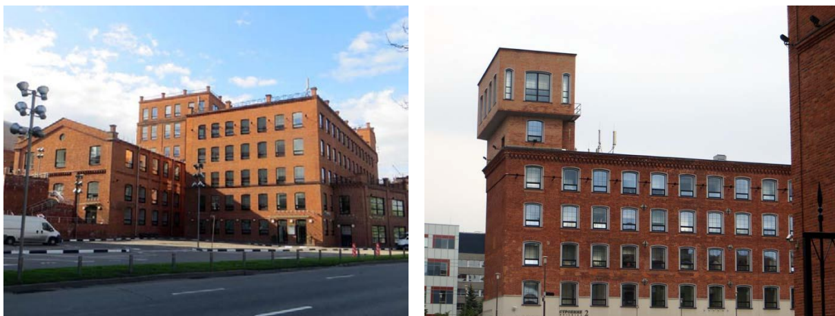
Рис. 1. Строения бывшего Товарищества шёлковой мануфактуры, сейчас Деловой центр «Лефорт»

Интересны предложения по перепрофилированию старого предприятия тем, что на большой площади бывшего промышленного производства расположились культурный центр, выставочные и торговые павильоны, музейные залы. Но существует и другое направление – сохранение производства, где реконструкции подвергается прилегающая территория, в основном, для развития туризма.