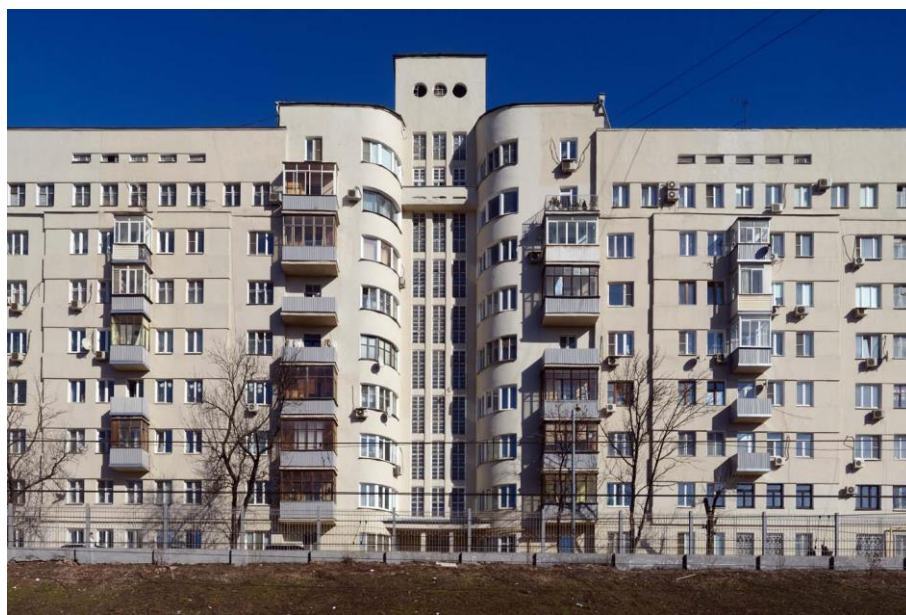
Рис. 3. Жилой дом-коммуна кооператива «Обрабстрой». Арх. В.К. Кильдишев, 1931 г. Басманный тупик, д. 10/12

Жилой дом-коммуна кооператива «Обрабстрой» (арх. В.К. Кильдишев, 1931 г., Басманный тупик, д. 10/12) (рис. 3) был принят в число вновь выявленных памятников исключительно по настоянию жителей. Так, главные инициаторы подачи заявки в Мосгорнаследие стали авторами книги, посвященной дому [2].