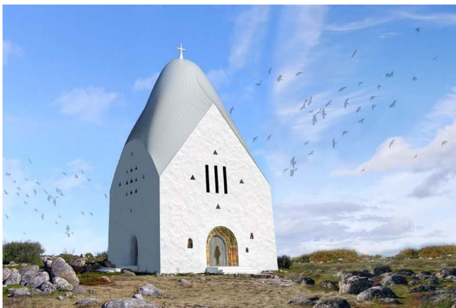
Рис. 2. Один из современных «поисковых» образцов с неотчетливыми типологическими границами. Образ балканского храма. Малый храм для Русского Юга

В современности, видимо, из-за ослабления по вполне понятным историческим причинам реально существующего знания религиозных основ жизни, понимание того, что же именно является типологическими границами архитектуры православного храма в некоторой степени размыто. Отсюда рождаются и попытки достаточно «слепого» новаторства без понимания сути вопроса, в результате чего рождаются формы холодные, не согретые внутренним молитвенным теплом и не стремящиеся к небу как огонь, если вспомнить сравнение Е.Н. Трубецкого. Они скорее напоминают вымученно втянутые вакуумным насосом в некие формы пластиковые оболочки, которые по законам реологии при изменении температуры с радостью вернулись бы в исходное состояние заготовки (рис. 2).