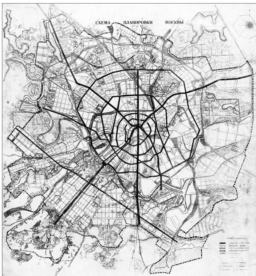
Рис. 4. Схема основных магистралей Генерального плана реконструкции Москвы. 1935 г.

Нельзя отрицать тот факт, что Л.М. Каганович, которому без преувеличения принадлежит ключевая роль в составлении схемы основных магистралей Генерального плана реконструкции Москвы 1935 г. (рис. 4), активно пользовался идеями, высказывавшимися архитекторами, правда, внося в них существенные коррективы. Так, идея И.В. Жолтовского о создании сквозной магистрали от Петровки в Замоскворечье, зафиксированная в публикациях о проекте преобразования площади Свердлова, была использована Л.М. Кагановичем при составлении схемы Генерального плана 1935 г. Отстаивая на очередном заседании Арплана 27 февраля 1935 г. идею диаметра «север-юг», Л.М. Каганович отмечал: «Тов. Жолтовский все время говорил относительно Петровки. Мы можем дать её для пешеходов, но если отвлечься от Петровки, отвлечься от конкретных вещей и брать магистраль, дающую нам ось, мы получаем эту магистраль значительно лучшую, чем Петровка» 29 . Иными словами, Л.М. Каганович развил локальное предложение для центра Москвы в идею грандиозной магистрали, которая будет сохраняться в ряде последующих генеральных планов столицы.