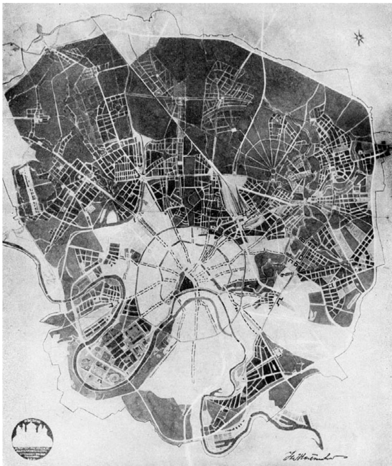
Рис. 1. План «Новая Москва». Эскизная схема архитектора И.В. Жолтовского. 1918 г.

большинстве публикаций за фактическим отсутствием иных источников опирается на воспоминания И.В. Жолтовского и касается его встреч с И.В. Лениным в 1918 г. На этих встречах, по словам архитектора, вождь революции давал указания о будущем развитии Москвы. Впервые небольшой фрагмент этих воспоминаний был приведен в 1954 г. в статье И.В. Жолтовского «О подлинной и ложной красоте в архитектуре» в «Строительной газете» 4 , цитаты из которой использовал в своей работе Г.Д. Ощепков [9, С.10-11]. В более развёрнутом виде эти воспоминания были опубликованы в апреле 1955 г. в газете «Советская культура» 5 , в 1957 г. – во второй книге «Воспоминаний о Владимире Ильиче Ленине» [10] 6 , и впоследствии пересказаны И.А. Мариенбахом [11, С.157,167]. Согласно этим публикациям в основу плана «Новая Москва» были положены принципы, одобренные и отчасти высказанные В.И. Лениным на встречах с И.В. Жолтовским. Среди них: развитие Москвы на юго-запад с учётом господствующих ветров этого направления, сосредоточение нового жилищного строительства на юго-западе, озеленение берегов Москвы-реки с целью создания «здорового, насыщенного кислородом резервуара воздуха». Однако эти упоминаемые в воспоминаниях принципы нельзя проследить в графических материалах, связанных с планом, хотя исследователи и отмечают тот факт, что ключевые идеи, заложенные в схеме И.В. Жолтовского в 1919 г., получили развитие уже в работе А.В. Щусева.