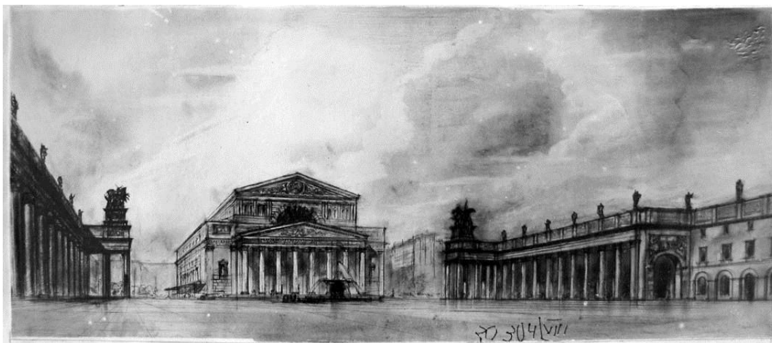
Рис. 2. Проект реконструкции площади Свердлова. Вариант. Архитектор И.В. Жолтовский. 1934 г.

Из предложений И.В. Жолтовского по преобразованию Аллеи Ильича и площади Свердлова 1932 г. так ничего и не было реализовано. В начале 1934 г. в журнале «Архитектура СССР» была опубликована ещё одна небольшая статья, посвящённая реконструкции площади Свердлова, но уже за авторством самого И.В. Жолтовского. Согласно её тексту, принципиальная позиция архитектора относительно путей реконструкции площади практически не изменилась (рис. 2,3). Главным сооружением площади Свердлова должен был остаться Большой театр. Его планировалось соединить колоннадой, «насыщенной скульптурой», со зданиями Малого театра и 2-го МХАТа. И.В. Жолтовский считал, что «таким образом здание Большого театра будет зажато как бы в тисках, что сделает чрезвычайно острым и выразительным его архитектурное лицо» [16, С.14]. Он также вновь повторял идею магистрали, соединяющей площадь Свердлова с Замоскворечьем. Однако самым ценным в этом небольшом тексте было то обстоятельство, что в нем впервые были зафиксированы мысли И.В. Жолтовского, которые с некоторой долей допущения можно рассматривать как положения его градостроительной теории. Именно эти мысли получили развитие в рассуждениях архитектора 1950-х гг. о динамических и статических элементах города [8].