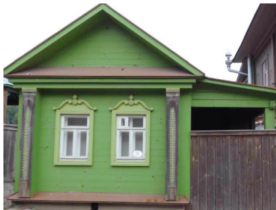
Рис. 3. Плес. Жилой дом на Никольской ул.

Застройка территории на первый взгляд кажется колоритной и разнообразной. При более подробном анализе становится заметно многократное повторение мотивов декоративного убранства старых построек на фасадах новых объектов. Причем в соседних домах сосуществуют подлинники и их современные версии. По мере обследования обнаруживается тиражирование нескольких характерных местных приемов резьбы наличников, угловых лопаток, завершений печных и водосточных труб. Так, в оформлении фасада воссозданного деревянного одноэтажного дома (Варваринская ул., 5) использована форма строгих рамных наличников с сандриками и резьба торцевых досок в виде симметричного стебля, повторяющаяся на фасаде расположенного неподалеку небольшого старого домика (Никольская ул., 6), с той разницей, что современное исполнение отличается большей механистичностью и упрощением проработки деталей (рис. 3, 4).