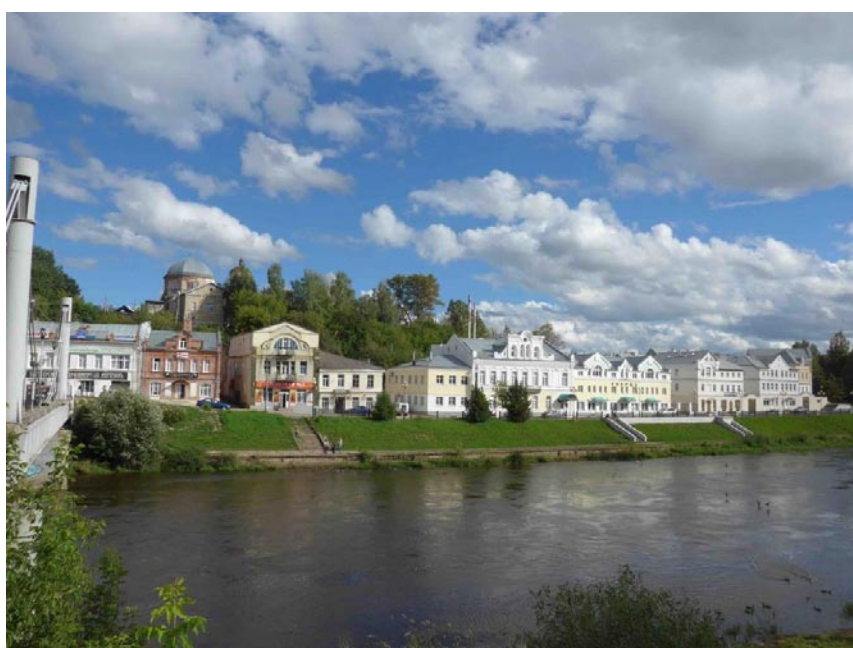
Рис. 1. Торжок. Новый жилой комплекс в застройке набережной р. Тверцы

Новый комплекс преследовал цель продолжить парадный фронт застройки набережной на левом берегу р. Тверцы. Сохранившаяся старая застройка на этом участке представлена рядом жилых зданий начала XIX века, несколькими домами второй половины XIX века и домом в стиле модерн 1911 года постройки. Дома преимущественно двухэтажные с неширокими прозорами между ними. Вплотную к одному из них, дому Грабинского (памятнику архитектуры регионального значения), одной из самых заметных построек набережной, примыкает новый корпус. Характерно, что он не конкурирует с памятником по насыщенности декоративного убранства фасада, тактично уступая первенство. Предметом стилизации стал только фигурный аттик исторического здания, а прорисовка деталей разрабатывает тему, взятую с фасада дома в стиле модерн, расположенного выше по набережной. Это тема треугольного фронтона и вписанного в него полукруглого окна, разыграна в декоре всех четырех корпусов, выходящих на реку (рис. 1).