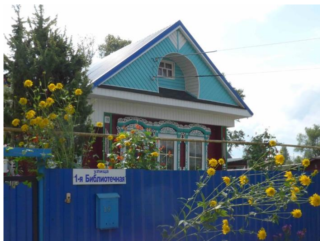
Рис. 8. Вичуга. 1-я Библиотечная ул., 19

Для сравнения – в соседнем малом городе Вичуге в районе 1-ой Библиотечной ул. усадебная застройка стихийно сохраняет устойчивую традицию оформления фронтонов жилых домов. Практически все постройки, и старые, и современные, имеют в тимпане фронтона луковичное или округлое заглабление. В большинстве случаев оно покрашено в синий или голубой цвет. Немногочисленные каменные дома тоже завершаются деревянным фронтоном с характерным сюжетом. При этом каждый дом имеет свое «лицо», поскольку двух одинаковых решений не встречается. Декор венчающей части дома может поддерживаться богатой резьбой наличников, а может служить единственным композиционным акцентом фасада. Частная застройка увлекает разнообразием интерпретаций традиционной иконографии и динамикой развития уличных перспектив (рис. 8,9).