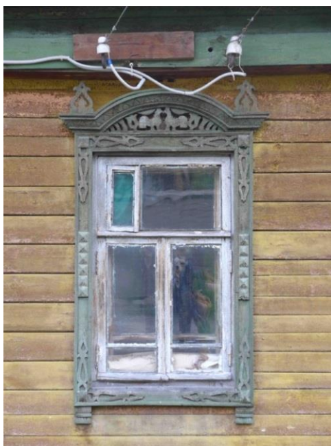
Рис. 6. Плес. Оригинальный наличник старого дома

В построенном «по образцу» одноэтажном деревянном доме с вальмовой кровлей и пятью окнами на уличном фасаде (Варваринская ул., 15) в оформлении наличников использован мотив с парой петушков, заимствованный из декора соседнего обветшавшего дома. Композиция старых наличников традиционна для Плеса: боковины украшены точеной резьбой, а очелье – пропиленной, с характерным сюжетом. В целом старый наличник отличается выверенным композиционным решением и лаконичностью (рис. 6). В современном аналоге очелье оформлено накладными деталями, также как боковины и добавленные подоконные доски. Геометрия рисунка более простая, некоторые фрагменты приближаются по характеру к вышивке (рис. 7).