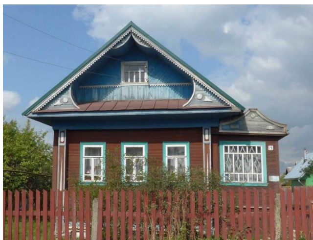
Рис. 9. Вичуга. 1-я Библиотечная ул., 20