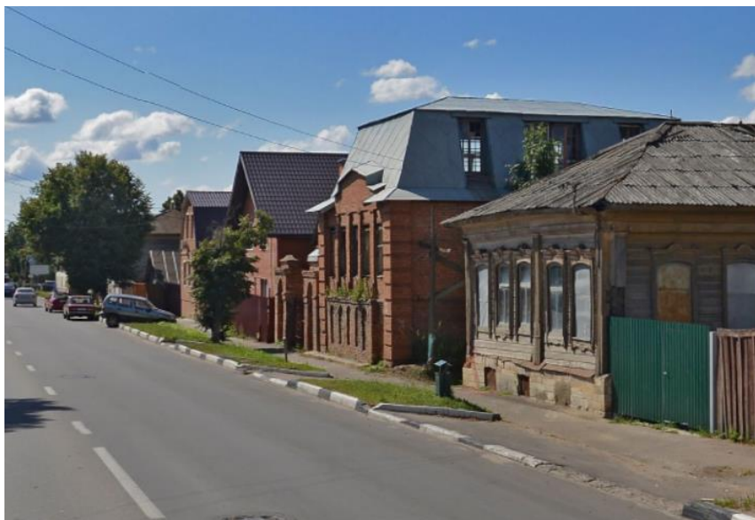
Рис. 2. Зарайск. Застройка Первомайской ул. Дома №34-40 https://yandex.ru/maps/10728/zaraysk

Более типичной является ситуация, когда черты традиционности архитектурного рисунка используются локально – для вписывания в старый город только одного или нескольких новых сооружений. Обратимся к весьма показательному примеру из опыта современной застройки Зарайска. На одной из важнейших исторических улиц города – Первомайской, на месте утраты фрагмента старой застройки встали рядом три краснокирпичных дома, вроде бы не претендующие на близкое повторение типов старой застройки, но проявляющие иные черты иконографической связи старого и нового (рис. 2). В рассматриваемом аспекте важен весь комплекс трех домов, но особенно поучителен дом № 36. Двухэтажный дом с большой мансардой под вальмовой кровлей должен быть отнесен к типу компактного особняка с небольшим фронтоном, «купеческого» по терминологии упоминавшейся статьи 2016 года в журнале «Architecture and Modern Information Technologies». Наличие громоздкой вальмовой кровли, нарушающей характер упомянутого типа, компенсируется комплексом пластических черт фасада, отсылающих к иконографии неоклассицизма: рустованные углы, напоминающие пилястры; условно представленный фронтон, адресующий к прошлому несмотря на необычный каскад уступов на углах, традиционные лопатки, расположенные под фронтоном и напоминающие пилястры, а ниже их – подобие цоколя. Все это – система намеков на что-то старое, но пересказанное на современном языке и в материале, хотя и традиционном, но не характерном для данного типа зданий.