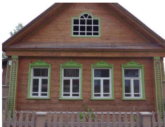
Рис. 4. Плес. Жилой дом на Варваринской ул.

Сюжет растущего вверх побега с листьями на угловых лопатках обшитых тесом жилых домов использован в подавляющем большинстве построек, как старых, так и современных. Он же используется для оформления торцов в образцовых проектах деревянных домов. В большинстве случаев побег опирается на резной ромб в нижней части лопатки, который символизирует вспаханное поле. В декоре угловых пилястр дома 14 по Варваринской ул. в цветах российского флага подчеркнута схематично выполнен упомянутый выше сюжет растущего побега, которому на соседнем фасаде отвечает сохранившийся оригинал (рис. 5).