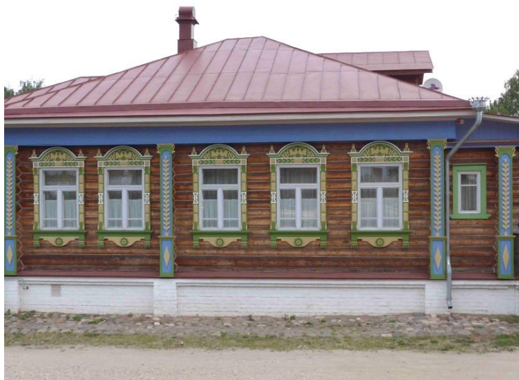
Рис. 7. Плес. Жилой дом. Варваринская ул., 15

Запоминающийся сюжет с петушками – один из наиболее часто встречающихся в новых постройках. Именно он лег в основу образцовых проектов деревянных домов, которые используются для строительства в исторических кварталах города. Практика Плеса показывает, что использование образцовых проектов при реконструкции должно быть ограничено пропорциональным соотношением новой и старой усадебной застройки. Расположение нескольких «образцовых» домов поблизости друг от друга разрушает естественность и разнообразие сложившегося типа среды.