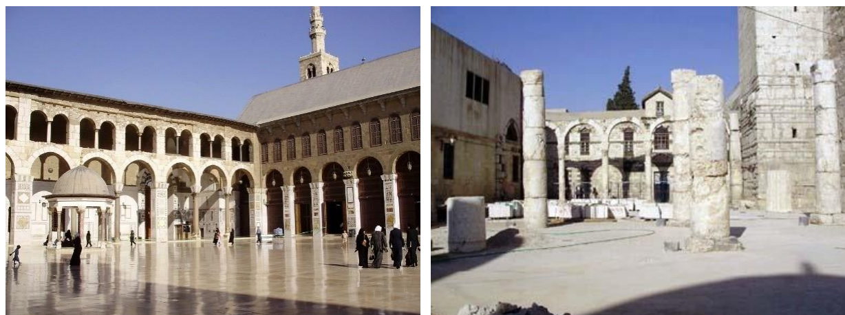
Рис. 2. Колонны внутреннего двора мечети Омейядов. Напоминают о существовании на этой территории древних строений римской и византийской эпох

строительстве мечети Омейядов использовали архитектурные детали ранее разрушенных зданий: христианской святыни и строений периода римского владычества. Представление о совершенстве окружающего мира материализуется в строй колоннаде, окружающей многоколонный молитвенный зал и прямоугольный в плане открытый двор, совершенном центральном куполе.