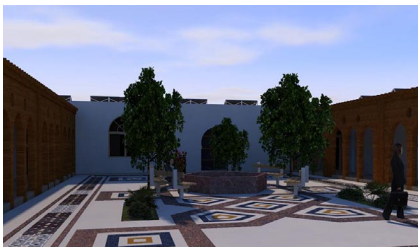
Рис. 8. Проектное предложение внутреннего двора школы для девочек. Автор Кристина Шахин. Научный руководитель Е.В. Малая

Для покрытия пола внутреннего двора школы использован оригинальный рисунок, выполненный из мраморной мозаики по старинным технологиям.