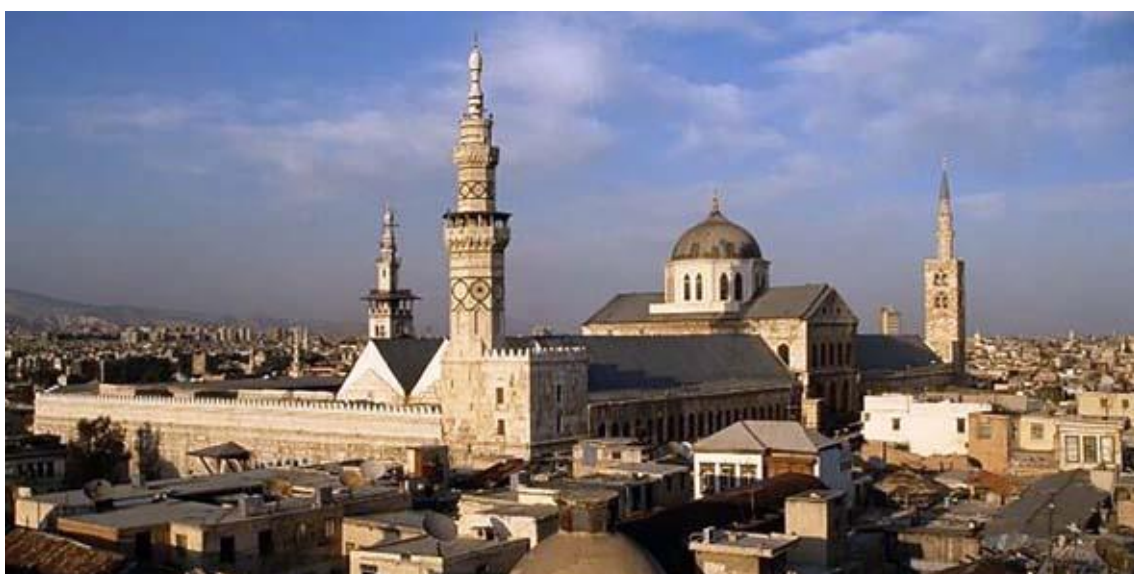
Рис. 5. Вид мечети Омейядом и прилегающих торговых кварталов старого города

Традиционно главным общественным пространством города был торговый рынок у храма на центральной городской площади. В Дамаске к стене мечети Омейядов примыкают торговые ряды, медресе, библиотеки, больницы, обеспечивающие постоянный приток к центру жителей города и туристов (рис. 5). Создание уникальной школы для девочек и благоустройство территории рядом с древним памятником архитектуры окажет благотворное влияние на развитие культуры Дамаска.