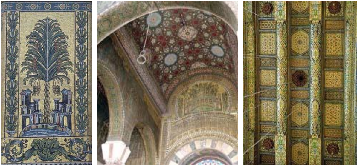
Рис. 3. Фрагменты мозаичного убранства мечети Омейядов