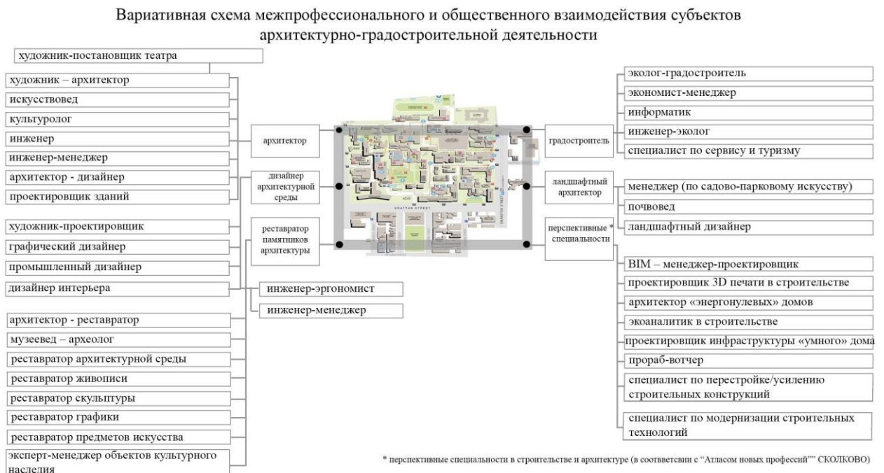
Рис. 1. Вариативная схема взаимодействия «профессиональных» участников архитектурно-градостроительной деятельности (Топчий И.В., автор)

Участников архитектурной деятельности, чьи результаты интеллектуальной деятельности являются охраноспособными и могут быть защищены авторским правом, следует отнести к профессиональным субъектам архитектурной деятельности (Рис. 1).