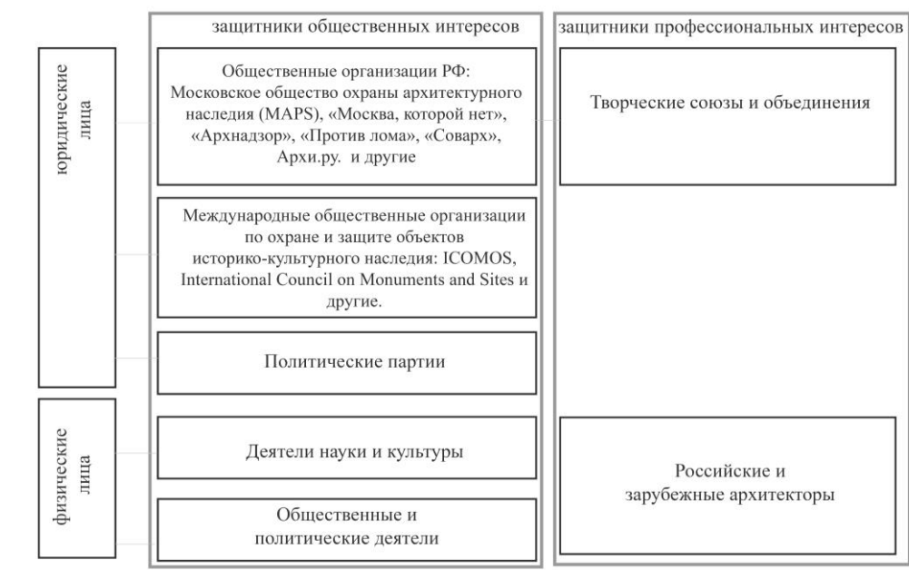
Рис. 2. Участники архитектурной деятельности, не являющиеся авторами проекта (Топчий И.В., автор)

В Градостроительном кодексе РФ предусматривается участие профессиональных экспертов и представителей общества в оценке проектных предложений (№ 190 ФЗ «Градостроительный кодекс РФ», ст.24). Это обстоятельство позволяет включать в состав субъектов АГД непрофессиональных участников (физических и юридических лиц), не являющихся авторами проекта (Рис. 2).