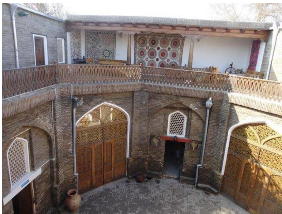
Рис. 3. Гостиница «Мехтар Амбар» в Узбекистане