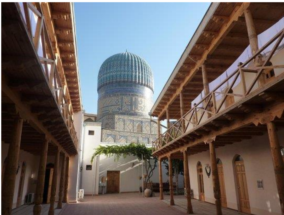
Рис. 5. Гостиница «Бибиханым», Самарканд, Узбекистан

Можно встретить также и юрточные лагеря – в Кыргызстане, к примеру, такой отдых предлагают на озере Иссык-Куль (Рис. 6).