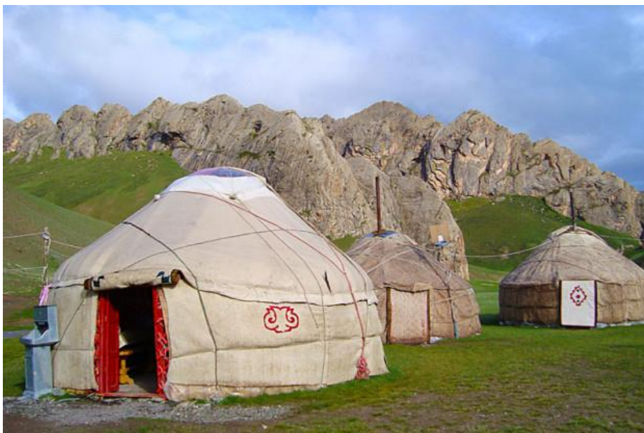
Рис. 6. Юрточный лагерь отдыха в Кыргызстане

Можно встретить также и юрточные лагеря – в Кыргызстане, к примеру, такой отдых предлагают на озере Иссык-Куль (Рис. 6).