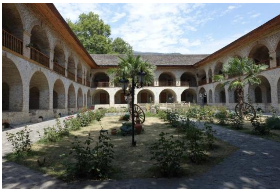
Рис. 4. «Юкари караван-сарай» – трехсотлетняя гостиница в городе Шеки, Азербайджан

Своеобразная планировка гостиницы «Бибиханым» в Самарканде рядом с комплексом Шахи-Зинда (Рис. 5). Всего в здании размещено 18 номеров, входы в которые организованы с общих открытых галерей первого и второго этажа. В оформлении фасадов использованы традиционные виды прикладного искусства Узбекистана – такие как резьба по дереву и резьба по ганчу. Интересно включение дерева в архитектуру здания во внутреннем дворе и его использование в разных деталях, при этом фасады здания выполнены из кирпича с традиционной мозаикой, что не контрастирует с исторической средой. Над рестораном расположена открытая терраса, откуда открывается красивый вид на старинный город.