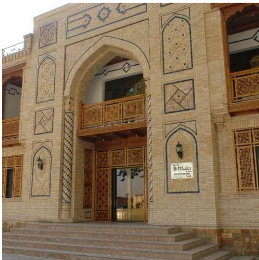
Рис. 2. Отель «Малика Прайм», Самарканд, Узбекистан

архитектурные памятники эпохи Тимуридов и застройку махалля, подчеркивающую национальный колорит города. Архитектура объектов туристического обслуживания, вслед за жилой застройкой, представляет собой геометрически правильные в плане фигуры, в основном квадрат или прямоугольник, низкой этажности, с внутренними дворами. Здания часто имеют национальные узоры на фасадах и в интерьере с резьбой и майоликой, террасы, видовые точки с крыш на исторические объекты. В основном это небольшие по вместимости объекты, где количество номеров варьируется от 10 до 30 (Рис. 2).