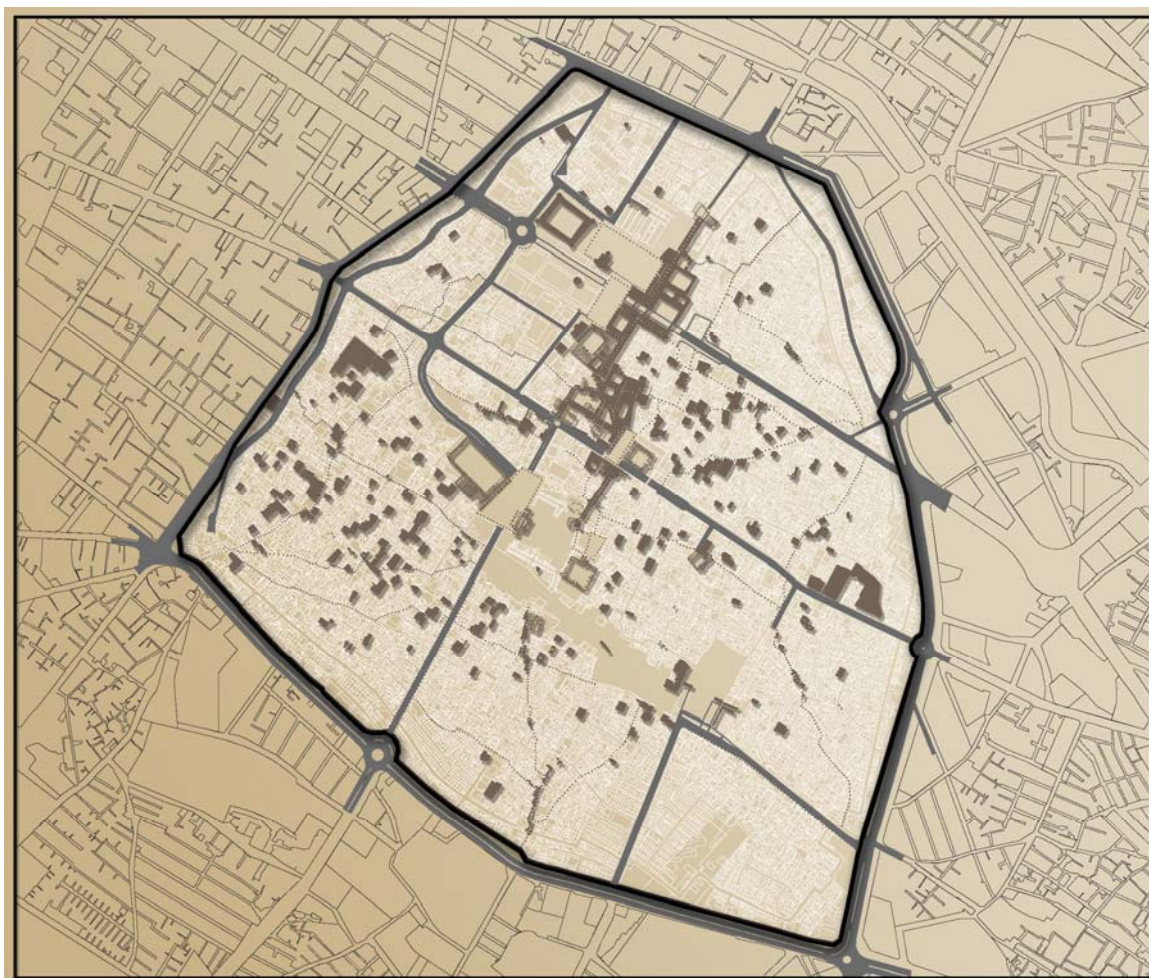
Рис. 4. Схема 1. Памятники старого города Шираза и его окрестностей

На схемах, показанных ниже, можно проследить туристический потенциал Шираза. (Рис. 4, Рис. 5, Рис. 6)