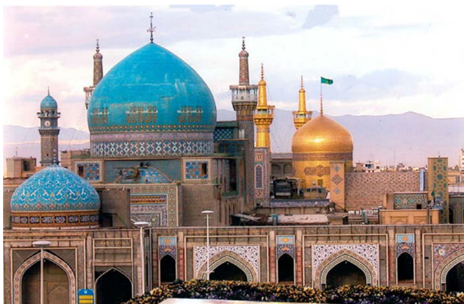
Рис. 1. Мешхед, мавзолей Имам Реза (V в.)

Подобные центры имеют своеобразные традиции. Так, например, город Мешхед, который является центром паломничества, посвященного восьмому Иمامу ислама, может принять не менее миллиона паломников Ирана и более миллиона мусульман, жаждущих посетить это священное место ежегодно. (Рис. 1)