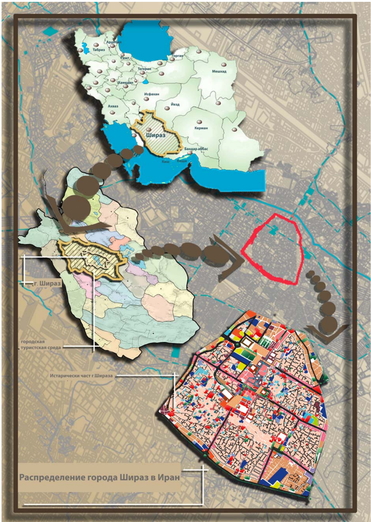
Рис. 6. Схема 3. Связь Шираза с другими памятными местами Ирана