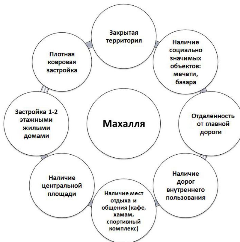
Рис. 2. Структура махалли

Жители махалли самостоятельно определяли границы махалли, напрямую влияя на них, строя новые дома в рамках внутренних договоренностей. Самое важное в махалли – каждый дом строился самостоятельно, по вкусу и желанию хозяев, без заранее готовых материалов – органически, с учетом климатических особенностей местности. С точки зрения объемов махалли сильно различались, у каждой был собственный вид. Появлялась определенная городская социальная культура.