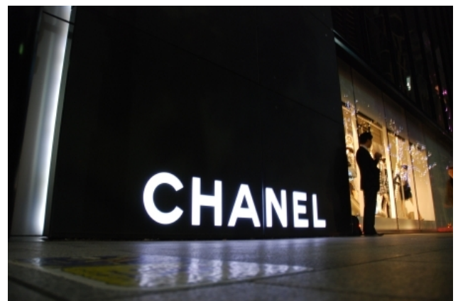
Рис. 4. Бутик Chanel, Ginza