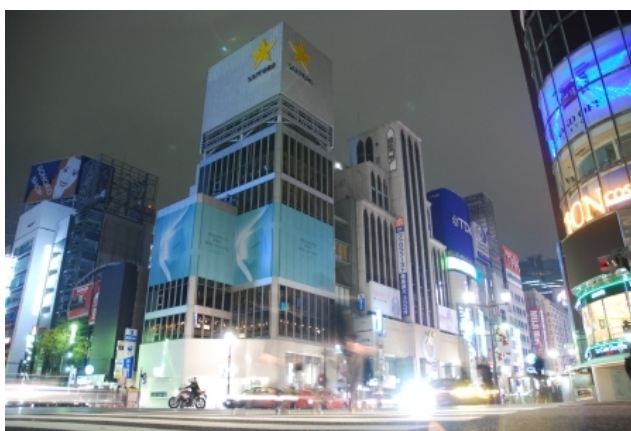
Рис. 9. Ginza