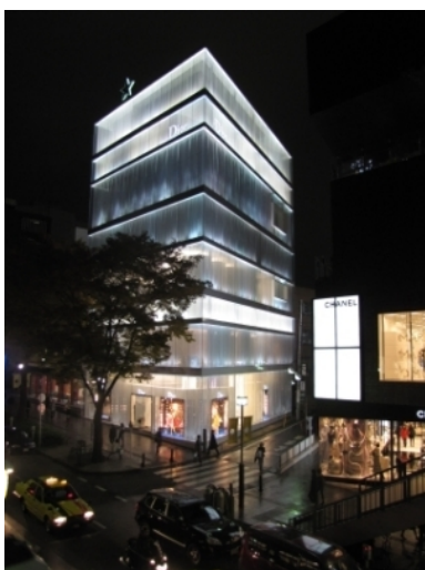
Рис. 11. SANAA, бутик Dior

Город соткан из архитектурных шедевров мировых и японских архитекторов. Яркий представитель - улица Омотесандо. Тадао Андо соседствует с Кишо Куракава, SANAA подпирает MVRDV, соревнуясь в изысканности архитектурного решения. Но при этом все едино, цельно. (Рис. 11, Рис. 12, Рис. 13) При этом приятны глазу и безымянные, тихие постройки на соседних, менее оживленных улицах. Ничто не диссонирует. N&deM, в соседстве с гораздо более старыми постройками, гармоничен. Все объединено великолепным качеством исполнения в единую среду, где все наполнение работает на контрастах и нюансах. Это качество, добротность, чистота и собирает столь противоречивый город воедино.