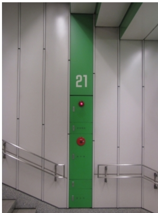
Рис. 15. Система метро Токио