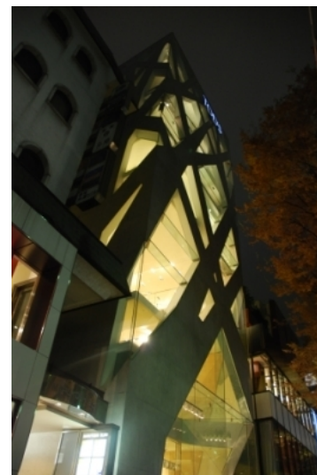
Рис. 13. Toyo Ito, бутик Tod's