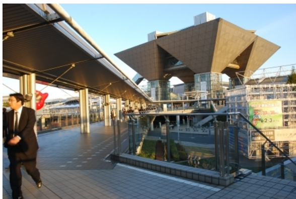
Рис. 7. Tokyo International Exhibition Center

Здесь характерны размеры нарочито увеличенные, с малым количеством масштабных и мелких деталей, что обеспечивает ощущение «нереальности» и колоссальных габаритов (Рис. 7, Рис. 8, Рис. 9). Процессы, как правило, ориентированы на нестандартность, динамичность, и даже некоторую праздничность и торжественность. Соответственно и оборудование либо полностью исчезает, либо приобретает иной масштаб и иную роль в данной среде.