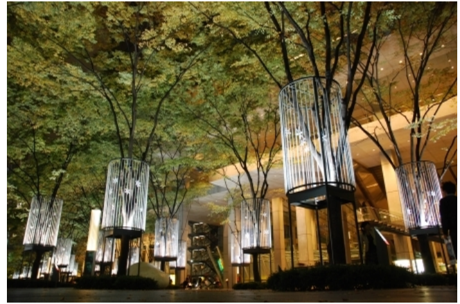
Рис. 2. Tokyo International Forum