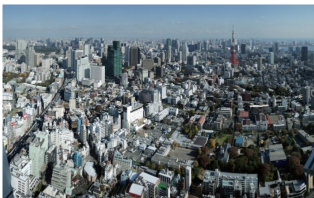
Рис. 16. Центр города. Вид с башни Roppongi Hills

Любой проект 60-х годов – это, прежде всего, не новаторская архитектурная форма, и не «космические» технологии и конструкции, а влияние на образ жизни людей. Под влиянием смело вносимых предложений по реорганизации пространств меняется ритм жизни, распорядок дня, способы ориентации в пространстве, пересматриваются пути перемещения и т.д. И на этом японские архитекторы не останавливаются - у них и сейчас есть в запасе варианты дальнейшего развития города. (Рис. 16)