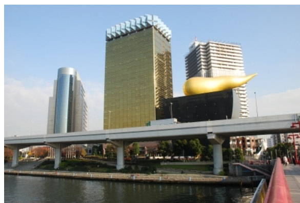
Рис. 8. Philippe Starck , здание пивоваренного завода Asah