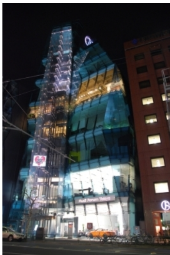
Рис. 12. Audi Forum, Omote-sando