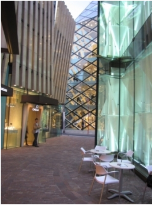
Рис. 1. Minami-Aoyama