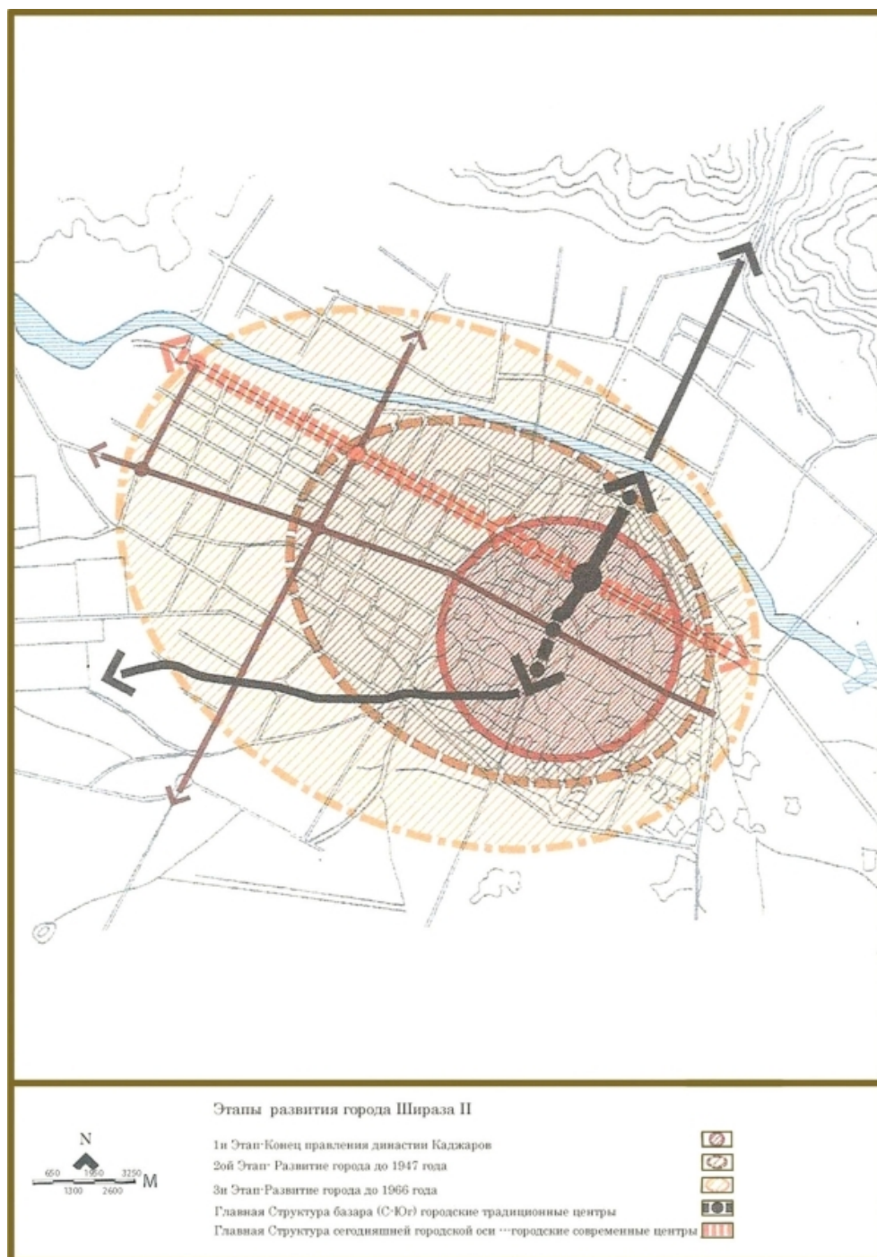
Рис. 2. Этапы развития города Ширази (2)

В середине 1970-х гг. Шираз становится региональным мегаполисом с мировым значением. В 1975 г. в Ширазе из-за близости к Персеполису – столице Ахеменидской империи, проходят основные торжества по поводу 2500-летия монархии в Иране. Город приобретает функции, среди которых выделяются функции учебно-образовательного, культурного и военного центра. На новый, более высокий уровень выходит современная городская культура, повышается качество жизни, что привлекает в город специалистов из академических кругов и профессионалов в различных сферах. Вслед за этим в городе возникает новая отрасль – сфера услуг, работники которой предоставляют различные услуги представителям различных категорий горожан. Все это в целом способствует коренным изменениям в пространственной структуре мегаполиса. Центр города перемещается в западном направлении в район проспекта «Занд» и окрестных улиц с современной застройкой. Старый центр города сохранил свою историческую планировку