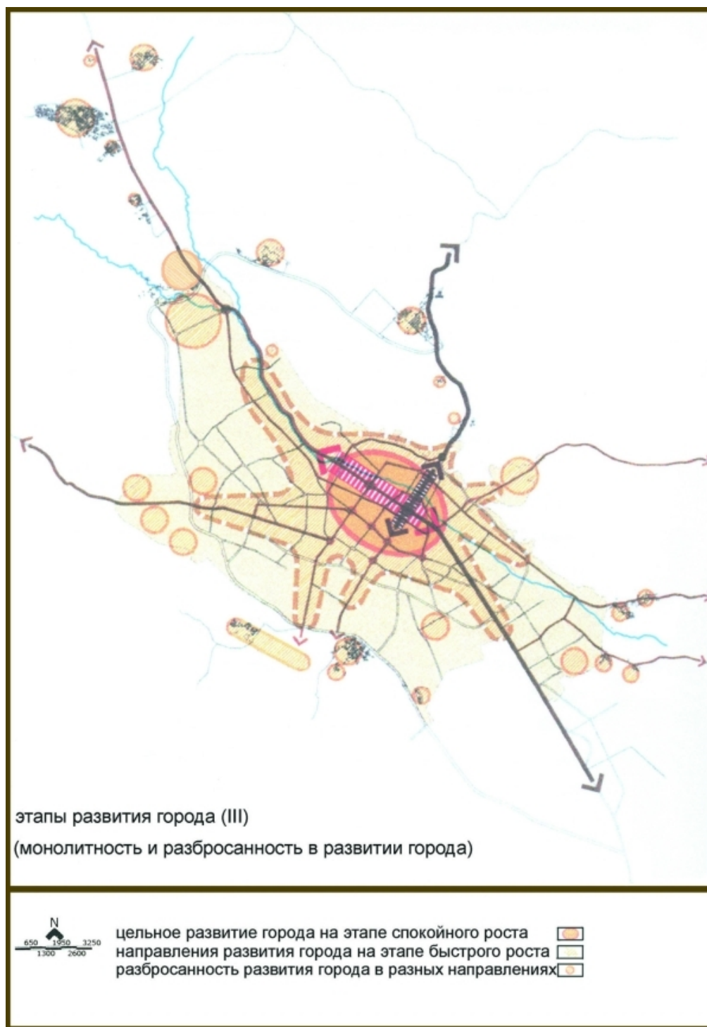
Рис. 3. Этапы развития города Шираза (3)

Подытоживая отмеченное выше, можно утверждать, что за 20 лет после Исламской революции в Иране (1979 – 1999 гг.) развитие города Шираза прошло два периода развития: