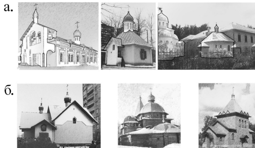
Рис.3(а,б). Примеры архитектурно-художественного подхода в практике приспособления зданий: а) сочетание двух архитектурных тем; б) полное замещение исходной архитектурной темы при приспособлении.

Практика приспособления предоставляет 4 архитектурно-художественных подхода, которые основаны на различном сочетании исходной и новой архитектурных тем – от полного сохранения первой в случаях, когда исходное здание представляет собой архитектурно-историческую ценность (Рис. 3а), до полного замещения (Рис. 3б). Среди этих приёмов наибольший интерес вызывает сочетание новой и старой архитектурных тем, которое строится на столкновении таких структурных признаков, как материал, фактура, цвет, масштаб и характер членений.