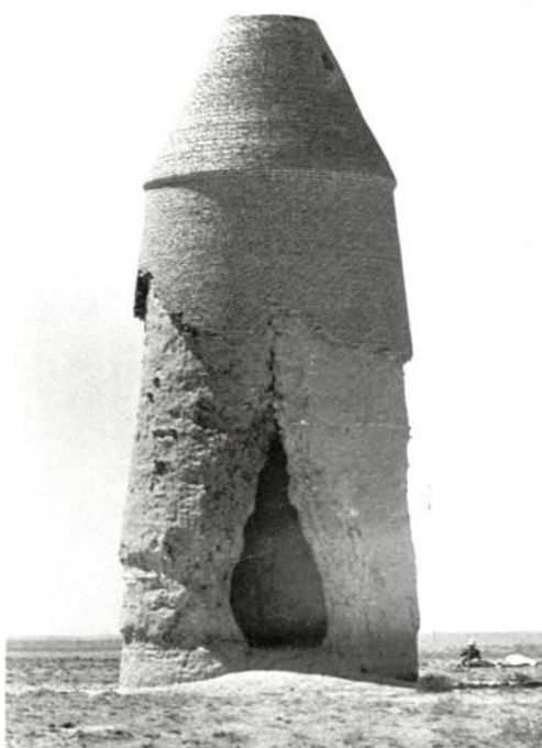
Рис.6 Мемориальные башни

В мемориальных башнях (Рис №6) – художественно выражено стремление к вертикальности, поэтому внутренние членения, как несущие лишь конструктивную нагрузку - не выявлены на фасадах.