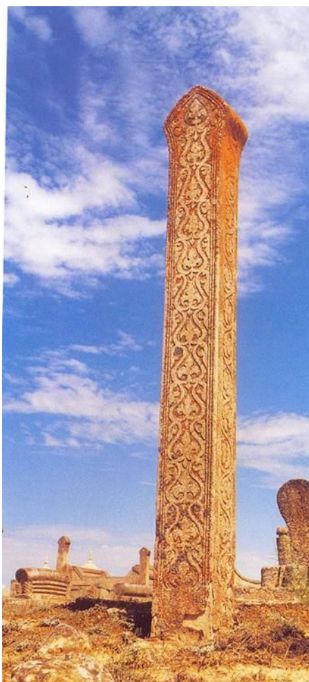
Рис. 4. Антропоморфная стела

Антропоморфные стелы (Рис. 4), относящиеся к 3-й группе, в тех случаях, когда они установлены у оградки лицом на восток; вероятнее всего, изображали более или менее рядовых воинов. Тогда же, когда такие стелы находятся в ряду балбалов, их можно связывать с изображениями врагов.