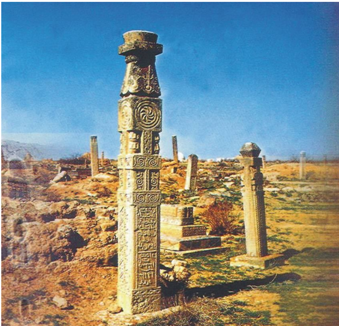
Рис. 5. Кулуп-тас

На протяжении многих веков балбалы и антропоморфные стелы видоизменились и превратились в кулуп-тасы (Рис. 5), чему способствовало проникновение мусульманской религии, преследовавшей «изображение живых существ».