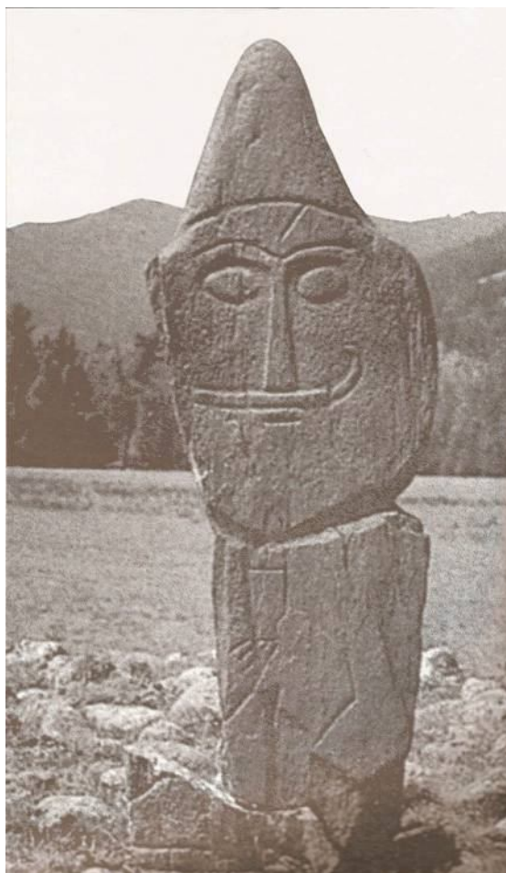
Рис. 3. Одежда и инвентарь балбалов

Наряду с оградками известны остатки значительных по размерам сооружений со следами стен и кровли. У таких сооружений находили скульптурные изображения животных (баран, черепаха), коленапреклоненных людей, фрагменты архитектурного декора и стелы с древнетюркскими надписями. Таковыми были орхонские памятники. Существуют следующие гипотезы возникновения балбалов: