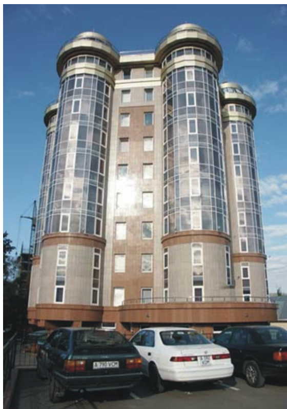
Рис. 2. Бизнес центр «Кулан».

«Валют-Транзит-Банк», одно из красивейших зданий в Казахстане, расположен в новом деловом центре г. Астаны на левом берегу р. Ишим, перед президентским дворцом и президентским парком. Общая площадь двадцати двух этажей бизнес-центра составляет 15700 кв.м. В составе помещений имеются офисы, VIP- офисы, офисы президента банка, конференц-зал, обеденный зал с кухней, хранилище банка, подсобные и технические помещения, VIP – паркинг, подземная и наземная парковка. Бизнес центр имеет коническую форму, его художественный образ незабываем (Рис. 3).