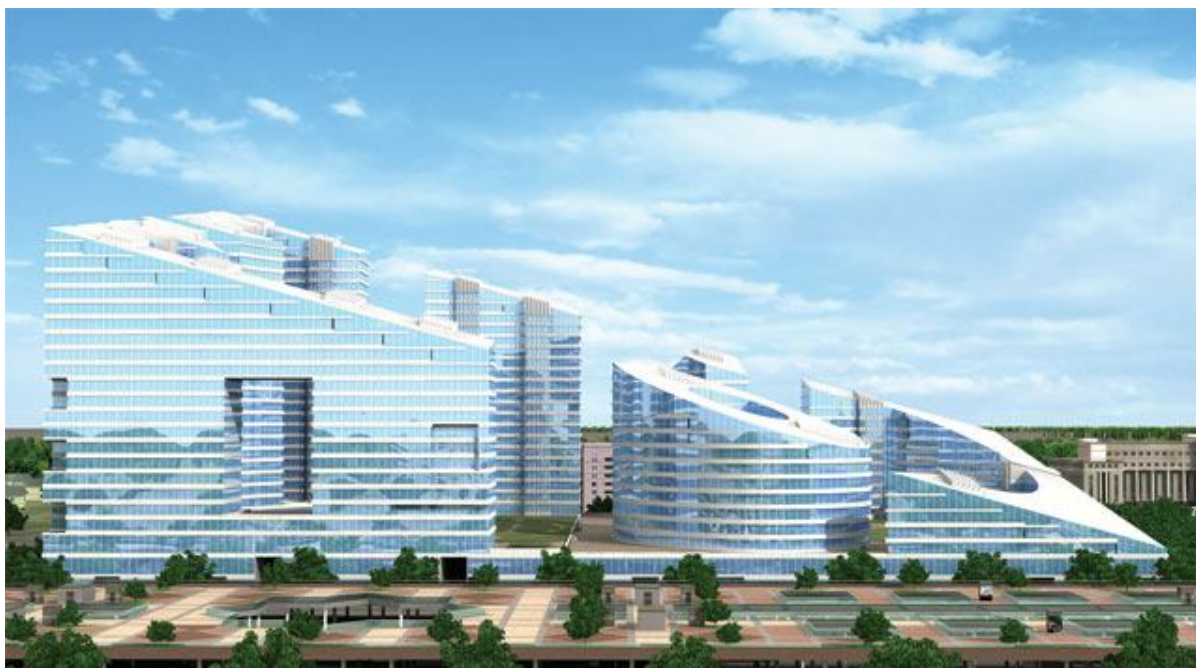
Рис. 4. Новый административный комплекс «На Водно-Зеленом бульваре».

высокоскоростными лифтами, системами отопления и центрального кондиционирования воздуха, освещение, вентиляция, телекоммуникации, пожаротушение спроектированы в соответствии с мировыми стандартами. Предусмотрены комфортабельные паркинги и места для гостевой автостоянки. Круглосуточная охрана и контроль всех систем жизнеобеспечения центра.