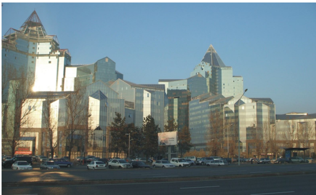
Рис. 1. Многофункциональный комплекс Нурлы Тау [1].

Многофункциональный центр «Нурлы-Тау» строится по принципу «город в городе». Его общая площадь составляет около 300 000 квадратных метров, а состоять он будет из четырех симметрично расположенных групп зданий переменной этажности - 6, 9, 12, 16 и 25 этажей. В соответствии с требованиями, предъявленными к офисам класса А1, они будут снабжены новейшими системами пожарной и охраны безопасности, бесперебойного электропитания, автоматической системы контроля над микроклиматом помещений, кондиционирования и приточной вентиляции, а также обеспечены современными телекоммуникационными системами и услугами Интернета.